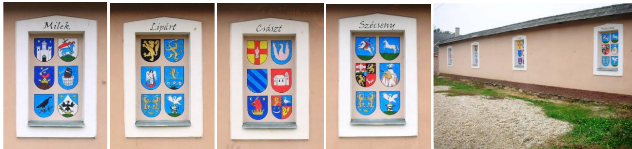
7. kép - Milek birtokosainak címerei: Vasvári ispáni vár, Koltayak, Bárdosiak; Milekiek, Mesterházi k, Polányi ak; 8. kép - Lipárt birtokosainak címerei: Ják nemzetség, Niczkyek, Vasvári Káptalan, Jákfalvi Horváthok, Festeticsek, Ebergényiek; 9. kép - Császt birtokosainak címerei: Heiligenkreuzi ciszterciek, Rozgonyiak, Ozorai k, Baumkircherek, Enyingi Törökök, Gersei Pethők; 10. kép - Szécseny birtokosainak címerei: Telekesi Törökök, Hevenessyek, Schilonok, Batthyányiak, Festeticsek, Ebergényiek; 11. kép - A Múltidéző emlékfala a Káptalan uralmi kerítése helyén

Miután tehát az eredeti elképzelést lesöpörte a képviselőtestület, és egy keresztény tartalmat (mint már írtuk a 800 évből 800 évig volt a Káptalan birtokosa valamelyik falurésznek) nélküli roszdás pellengér-szerű építmény született, a történelmi Milek területén kívül. A Múltidéző szerkesztője természetesen a történelmi Milek területére javasolta felállítani az emlékművet (nem messze az egykori mileki temetőtől), amit a képviselők azonnal elvetettek. (Az elkészült vas emlékoszlop fényképét nem közöljük, hisz az semmi tekintetben nem felel meg a műemléki elvárásoknak, a 87-es út mellett egy óriási kilométerkőnek hat.)