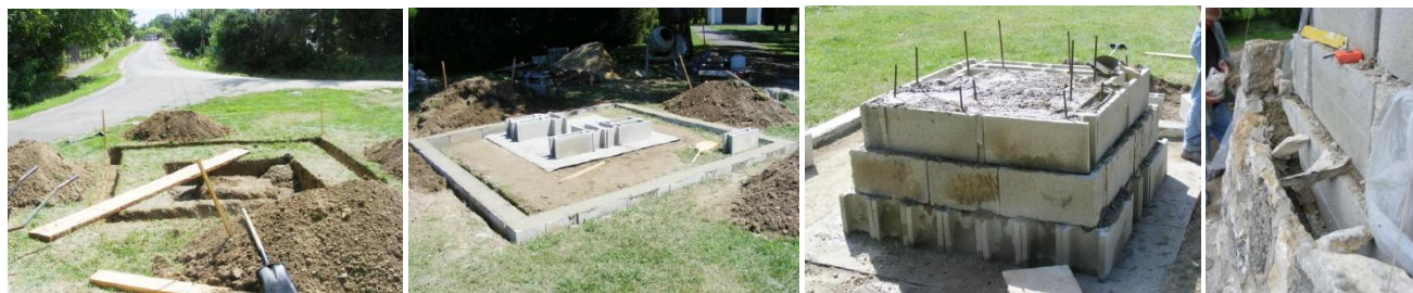
32. Az új alap kiása; 33-34. kép - A szigetelés után ezúttal betonelemek képezték az emlékmű magját; 35. kép - Felfalazásra kerül az új köpenyfal

A második szakasz az új alapok kiásával kezdődött. Ezúttal már nem maradt el az építmény szigetelése. Vasbeton elemekből épült fel a kúp alakú építmény magja, majd erre falazták fel a kőből a köpenyfalat, megfelelő helyekre beépítve a műkőfaragványokat (magyar címer, frontharcos címer, homlokzati dombormű) emléktáblákat. (A megrepedt I. Világháborús emléktáblát újra kellett faragni.) Amikor mindez elkészült, következett a kerítés visszahelyezése. Majd jött a zászlórúd és a turul visszahelyezése daruval. Mindez Augusztus 18-án történt. Az nap este érkezett meg az orkán erejű vihar, ami hatalmas károkat okozott a megyében és a faluban is. Szerencsére a felújított emlékműben nem tett kárt, ami a kivitelezés minőségét bizonyítja.