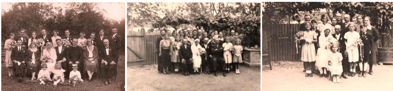
25-27. kép - Esküvői csoportképek

„Apámnak, szülőfalujába visszatérve iskolateremtő tevékenységét tovább folytatva, igen nagy tiszteletet sikerült a községben kivívnia. A gyerekekkel együtt a fiatalok nevelésével eredményesen alakította a község gondolkodását... haláláig elért legfőbb eredményei a lipártiak körében: a kölcsönös megbecsülés, az öregek tisztelete, a szorgalmas munka elismerése, a tisztességes beszéd, az előjárók elfogadása, a vallásosság kiszélesítése, a kölcsönös segítségnyújtás, a kultúra iránti igény növelése voltak.” (Sütő Károly Márk visszaemlékezése)