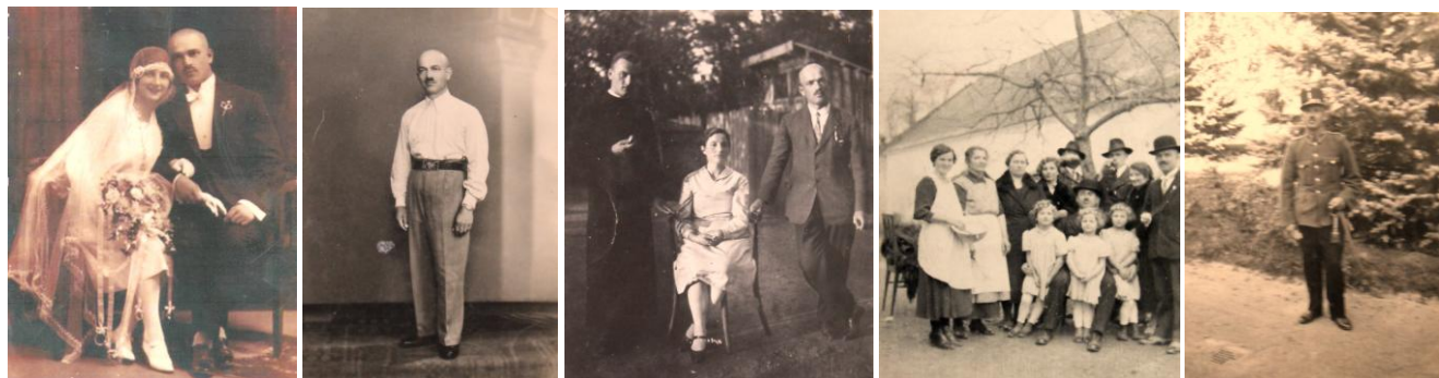
5. kép - Esküvői kép, 1925; 6. kép - A fiatal tanító; 7. kép - Feleségével és Máté paptestvérével; 8. kép - Csoportkép jobb szélén, 9. kép - Katonai egyenruhában