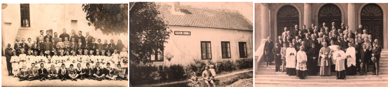
19. kép - Elsőáldozói csoportképen a kajdi templomnál 1930; 20. kép - A bárdosi iskola előtt gyermekeivel, 1931; 21. kép - Mikes János püspökkel, tanítói lelkigyakorlatos kép a szombathelyi szalézi intézet lépcsőjén, 1933

Két gyermekük halva született, ekkor útlevelet váltottak és Tarcsafürdőn gyógyfürdőt vettek, ezután öt gyermekük született még. 1931 szeptemberétől Bárdosra neveztek ki tanítónak, október elején el is foglalta új állomáshelyét.