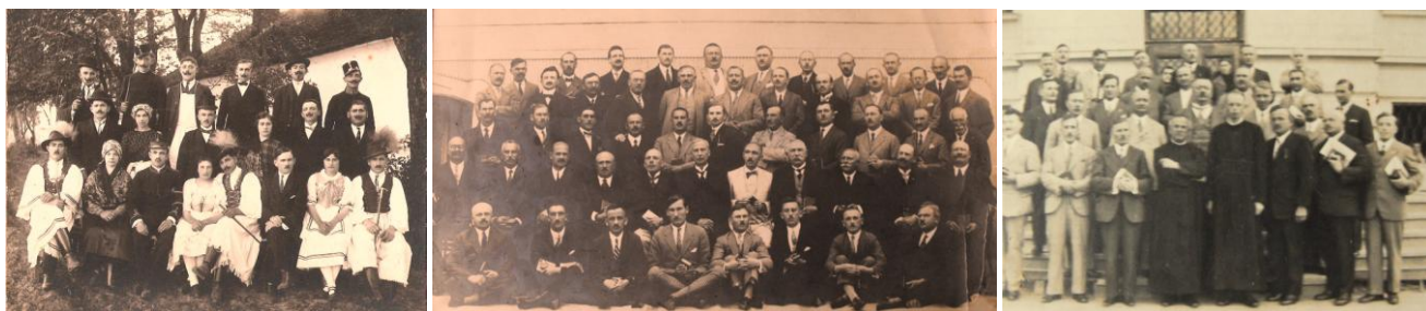
16. kép - Lipárti színjátszókkal, 1924; 17-18. kép - Kántortanítói lelkigyakorlatok csoportképei 1925, 1927