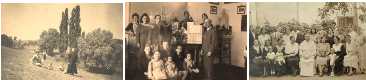
22. kép - A bárdosi dombon gyermekeivel és paptestvérelével, 1933; 23. kép - Bárdosi családi karácsony az új bárdosi iskolakápolnában, 24. kép - Csoportkép egy premontrei atyával