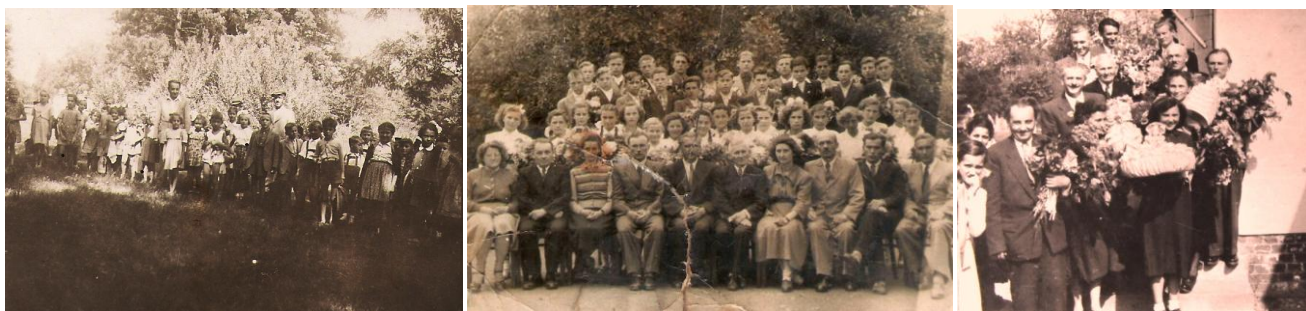
34. kép - Szabad program a lipárti győpön, 1951, 35. kép - Tantestületi csoportkép, 1953; 36. kép - Tanérvzáró, 1954

1959 decemberében a távozó Káldy Lajos iskolaigazgató helyére választották meg. (Káldy Lajos ezzel hálalta meg, hogy a forradalom napjaiban megmentette az életét.) 1960. április 16-án, a magtáriskolában a Betyár kendője szindarab próbáján rosszul lett, kicsit meg is tántorodott, de ennek ellenére végigkísérte a próbát. Délben hazamenetel közben összeesett az utcán és meghalt. (A tanév végén ment volna el nyugdíjba.)