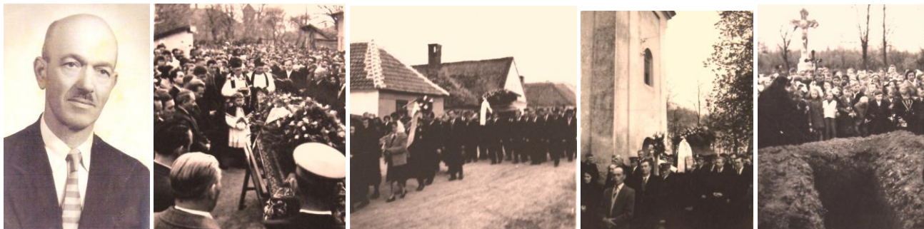
43. kép - Az igazgatótanító, 1958; 44. kép - Búcsúztatás a sarok iskola udvarán, 1960, 45. kép - A gyászmenet a Főszögben, 46. kép - A lipárti temetőben; 47. kép - A sírgödör

Vasszécseny vagy Tanakajd még éjjel sem, mert igazi tanító és nevelő voltál. Mi pedagógustársaid bámultuk frissességedet, mozgékonyaságodat, nagyszerű élettapasztalataidat, alkotókedvedet, munkabírádságot, következetességedet, pontosságodat, szorgalmadat az oktató-nevelő munkában akár az iskolában, akár az iskolán kívüli társadalmi munkában. Te nem voltál sohasem fáradt, ha a népért, a közért, a falvaink felemelkedéséért kellett munkálkodni vagy pedagógustársaid sorsáról volt szó. Küzdelmes, gondterhes életet éltél kedves barátom, de nem csüggedtél. Felsőbb hatóságainknak engedelmességedre 1931-ben elmentél tanítani Bárdosra is 1944-ig. Elmentél pusztai iskolába is, hogy küzdelmes munkával felépítsd az új bárdosi iskolát.