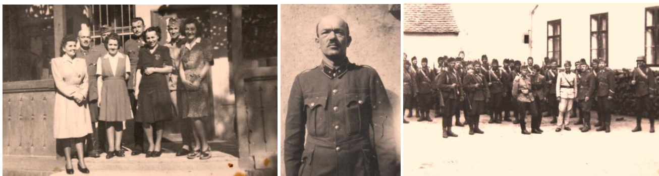
28. kép - Csoportkép a lipárti Stöger vendéglő kerthelyiségében; 29. kép - Főhadnagyként, 1945; 29. kép - 30. kép - Katonák közt, 1945