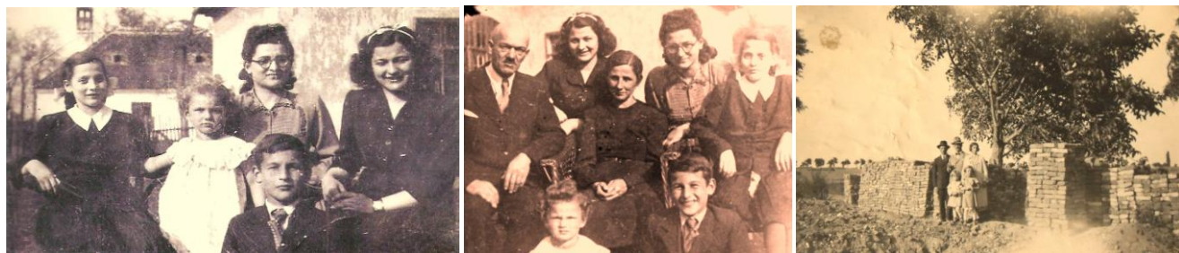
40-41. kép - A tanai ház udvarán a család, 1958; 42. kép - Az épülő ház téglakupacai közt