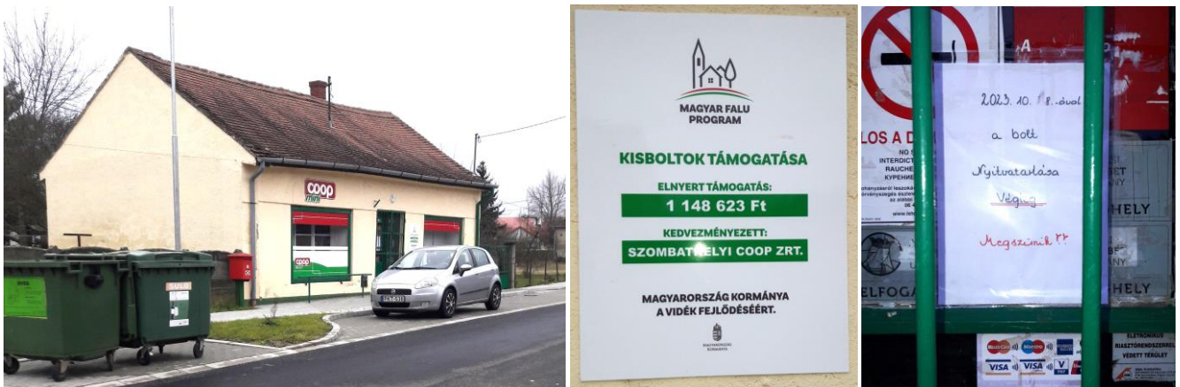
15. kép: A lipárti bolt épülete és környezete a megszűnésekor; 16. kép: A Lipárti boltra kihelyezett tábla az állami támogatásról; 17. kép: Az utolsó lipárti boltos kiírása a boltajtóra a bolt végleges bezárásáról

A boltnak a megszűnése azonban nem szokványos, mivel épp a megszüntetése, bezárása előtt lett állami támogatással felújítva a környezete a Magyar Falu Program keretében „a vidék fejlődéséért”, ahogy ezt az épület falára elhelyezett tábla közli velünk. A bolt bezárásával épp visszafejlődött, elmaradottabbá vált Lipárt. (A Múltidéző korábbi számai itt elérhetők: http://vasszecsényimultidezo.hu/ )