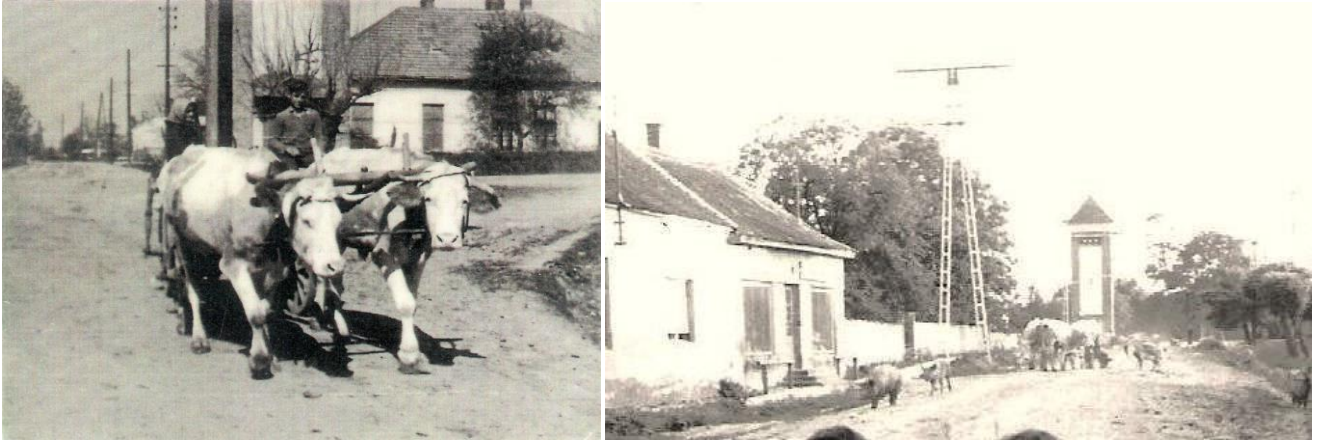
11. kép: Ökrös szekér az 1913-ban átadott új lipárti katolikus iskola előtt, háttérben a régi iskolaépület, immár vegyesboltként; 12. kép: A lipárti vegyesbolt, háttérben a sarokiskola előtti villanytorony