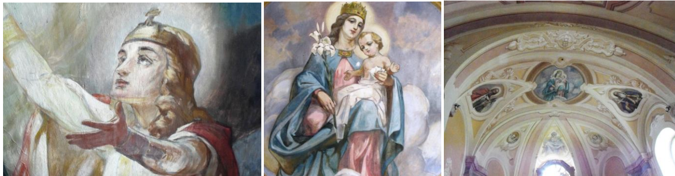
16. kép: Szt. Imre szüzességi fogadalma (részlet) Lipárt; 17. kép: Patrona Hungariae, Lipárt; 18. kép: A lipárti templom szentélyének mennyezet-seccói