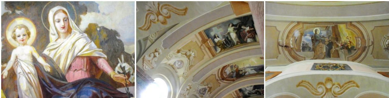
22. kép: Szt. Család (részlet) Lipárt; 23. kép: A lipárti templom hajójának mennyezet-seccói, Hit-Remény-Szeretet, Nagy Konstantin, Krisztus az Olajfák hegyén,1935; 24. kép: Szt. Cecília a lipárti templom kórusa felett

változatban Mária mennybevétele, a Szentháromságot, a Szt. Családot a kis Jézussal és kis Keresztelő Szt. Jánossal jelnetet, valamint az Ószövetségből Ábrahám áldozatát, az Összülők kiűzése és a Káin és Ábel jelenetét, végül az Isten kihirdeti a tíz parancsotot jelenetét kérte tőle.