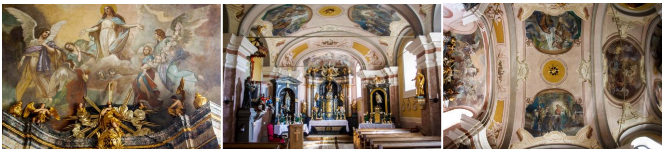
13-15. kép: A Dozmati templom seccói, 1935

Kettő ilyenről tudunk. Az I. Világháború utáni több éves hadifogságból hazatérve, fiatal házasként, hirtelen felindulásból, szerelemféléstől egy szilveszteri éjjelen megölte első feleségét, amiért több évre elítélték. (Caravaggio és Benvenuto Cellini is ölt embert, művészetük megítélését azonban ez nem befolyásolja.) Kiszabadulása után festette ki a Jászberényi Ferences templomot (1929), a Jánosházi templomot (1931), a Mátraverebélyi kegytemplomot (1934), az Érsekudvartéri templomot (1934), majd a Lipárti (1935) -, Dozmati (1936) -, Egyházashollósi (1936), Gencsapáti (1937) és Bérbaltavári (1937) templomokat. Ebben az évtizedben hozta létre legszebb műveit, amik a maga nemében kis Sixtus-kápolnák, festett architektúrákba, háromdimenziós ornamentikákba zárt képtükrökben nagyszerűbbnél nagyszerűbb tradicionális kompozíciók, mennyezeteken és falképeken. Minden templom külön egység, ha néhol megismétlődnek is motívumok, jelenetek, Steffek mindig képes önmagához képest is megújulni. Pl. a Patrona Hungariae először a Jászberényi ferences templomban jelenik meg, majd megismétlődik Lipárton, ahol immár teljesen kiérlelt önálló kompozícióvá válik.