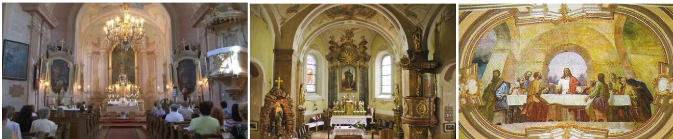
28. kép: A Mosonszentjános templom seccói; 29. kép: A Gencsapáti templom seccói; 30. kép: Az Utolsó vacsora a Gencsapáti templom szentélyének mennyezetén,1937

Steffek Albinnak életében egy kiállítása sem volt, halála után, 1993-ban egy emlékkiállítást rendeztek műveiből a Megyei Művelődési és Ifjúsági Központban (Rasperger József volt a rendezője). A kiállításról a Múltidéző szerkesztője „A festészet napszámosa” címmel a Vasszécsenyi Üzenet 93/8-as számában így írt: „Az idősebbek még emlékeznek rá, hogyan állványozta fel az akkor felújított templomot, milyen magányban, ugyanakkor milyen szorgalommal dolgozott. Hisz azon a nyáron is, mint ahogy szinte minden évben, két templomot kifestett. Szekéren hozta állványzatgerendáit, festőfeleszereléseit, és családját. Utóbbi mindig egy-egy családhoz szállásolta el, és mindenütt beosztották, hogy napról-napra ki kosztolja a művészt. Mindez békebelinek, idillinek tűnik, pedig nem is volt olyan régen, bő fél évszázada... Sohasem élt jó körülmények között, 'spártai elveihez' mindvégig ragaszkodott. (Mely szerint, ha egy napszamos napkeltétől napnyugtáig dolgozik pár pengőért, forintért vagy fillérért a kimerülésig, akkor neki, akinek örömet szerez a munka, a festés, ennél igazán nem jár több.) Steffek Albin mostani kiállítása reveláció volt, még az idősebb pályatársaknak is szenzáci-