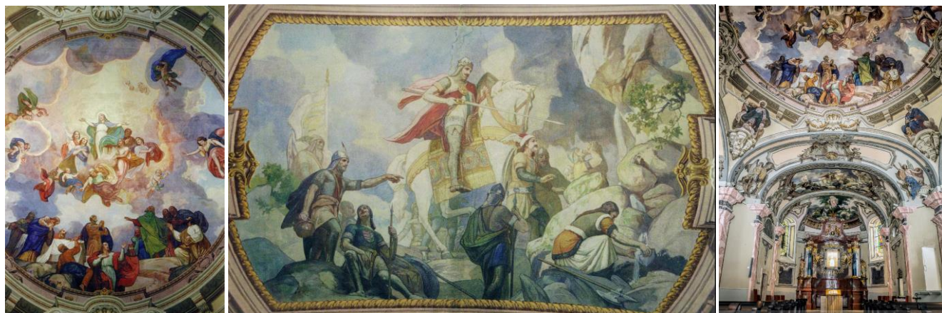
4. kép: Mária mennybevétel; 5. kép: Szt. László vizet fakaszt; 6. kép: A Mátraverebélyi templom mennyezet seccói, 1934