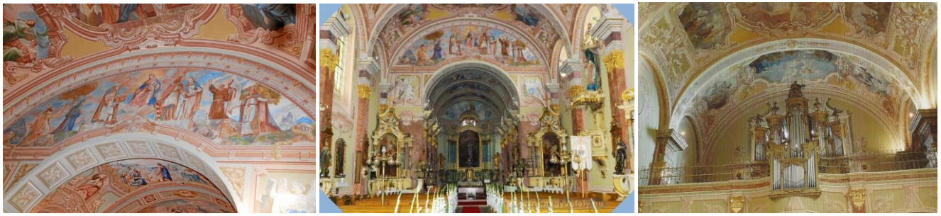
7-9. kép: A Jászberényi Ferences templom seccói, 1929

A székesegyház bombázásuk utáni újjáépítések során színvázlatot készített az elpusztult Winterhalder freskók újrafestéséhez. Képes lett volna rá, de nem bízták meg vele, ami nem biztos, hogy helyes döntés volt. Steffek Albinak a Szombathelyi Képtárban egyetlen műve sem található, emléktábla nem őrzi egyik lakásának helyét (Szent Márton utca, Batthyány tér) sem. Az első már rég lebontották, de a második épp a Képtár szomszédságában áll. Vasvármegyében, közgyűjteményként a Vasvári Békeház Képzőművészeti Gyűjteménye őrzi négy művét.