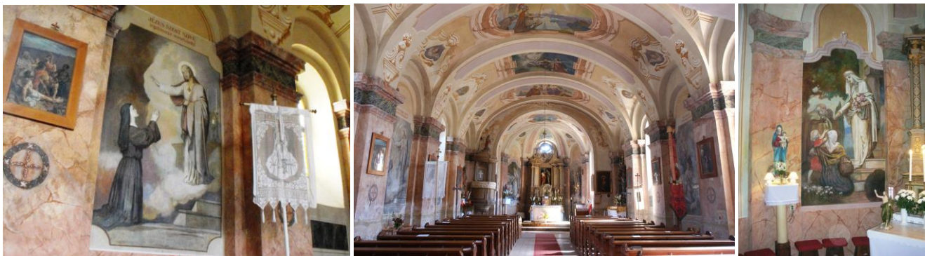
25. kép: Avilai Szt. Teréz, Lipárt; 26. kép: A lipárti Keresztelő Szt. János templom seccói,1935; 27. kép: Szt. Erzsébet rózsacsodája, Lipárt

Steffek Albin a lipárti templom kifestésével két hónap alatt (július, augusztus) készült el. Utána Mikes János püspök újjászenteselte a templomot, a 12 felszentelési keresztet ezután festette a falpillérekre. (A Vasvári káptalan volt a kegyura félezer éven át a templomnak.) Ez már ősszel volt, amikor is Steffek szemtanúja volt a szüreti felvonulásnak, így egy nagyméretű olajképben örökítette meg a szüreti felvonulókat. (A festményt megvásárlásra felajánlották a művész örökösei a falunak, de az nem tartott rá igényt, így nem sokkal később Ausztriába került.)