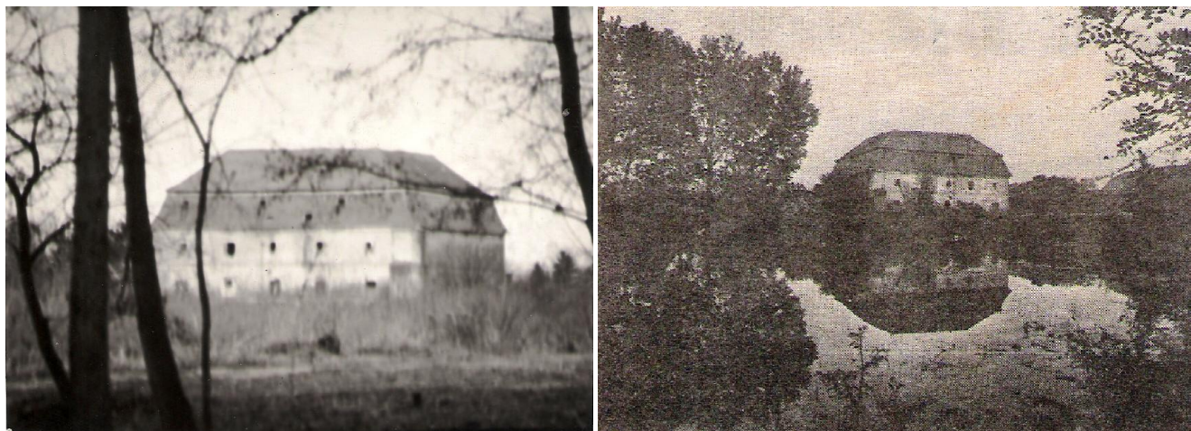
1-2. kép: Az előkerülés helyszíne, a barokk Festetics sörház (később magtár) melletti halastó, amikor még víz volt benne

Árpád-kor Szécsenyben, ezt a címet is adhattuk volna mostani számunkra. Falunk múltját a Múltidéző eddig is tőle telhető részletességgel tárta fel a napvilágra került régészeti leletek alapján. A Papkerti radiolit kőpengéktől és tűzkőtől kezdve a Kövesi kőbaltától és a kézzel formált (még nem korongozott) edénytöredékektől. A Kelta-kori kerámiatöredékektől a Papkertben, Kövesen, Egeralján és az ugyanitt, illetve Császtbányán előkerült római kori gazdag leletanyagokon (épületkövek, kisbronzok, érmek, kerámiatöredékek, Egeralján római út) keresztül, a Milek területéről előkerült Népvándorlás-kori és Árpád-kori edénytöredékekig (lásd Múltidéző 2016/3-as száma), ezért is nevezték a török után Lipártba beolvadt falurészt Ószögnek. Mindezek azt bizonyítják, hogy a falu, illetve annak egyes részei az őskortól kezdve lakott területnek számítanak napjainkig.