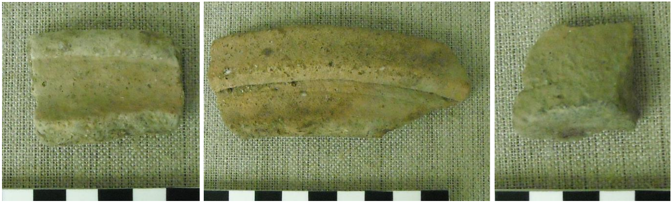
22-23. kép: Okker színű tálak peremtöredékei; 24. kép: Okker színű edényalj-töredéke

A kerámiaanyag sokszor szemcsés, kvarchomokos összetételű, a falvastagságuk a 2,5 mm-től 4-5 mm-ig változik, némelyik belül, néha kívül is szürke festésű.