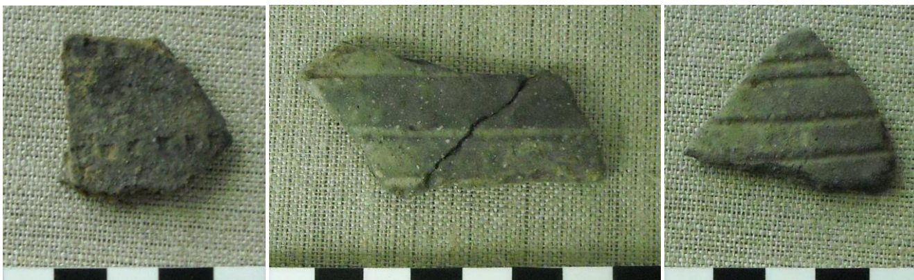
7. Négyzet-pontsoros díszítésű sűrű fazéktöredék; 8-9. kép: Sűrű és ritkásabb vonalsoros díszítésű sűrű fazéktöredékek

Eddig is sejtettük, hogy az egykori Festetics sörház melletti magaslat (Szécseny belterületének legmagasabb pontja) rejt a föld alatt Szécseny középkorát. A tőle nem messze lévő plébániaudvaron, a szoborpark szobrainak alapásásakor már került elő néhány szórvány kerámiatöredék ebből az időszakból.