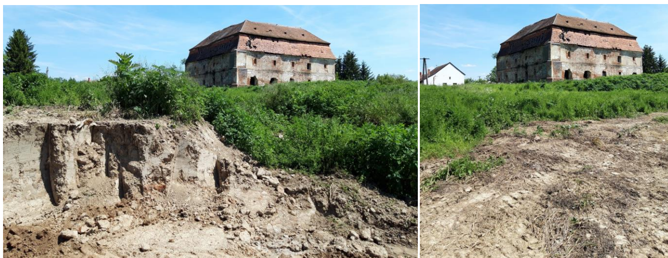
3-4. kép: Az előkerülés helyszíne, az egykori halastó kimélyítés közben

Most azonban Szécseny belterületéről kerültek elő Árpád-kori kerámiatöredékek, viszonylag nagy számban a XIII századtól a XIV. századig, egy két kerámiatöredék pedig a XV. századból való. A leletanyag korát a Savaria Múzeum régészeti határozta meg.