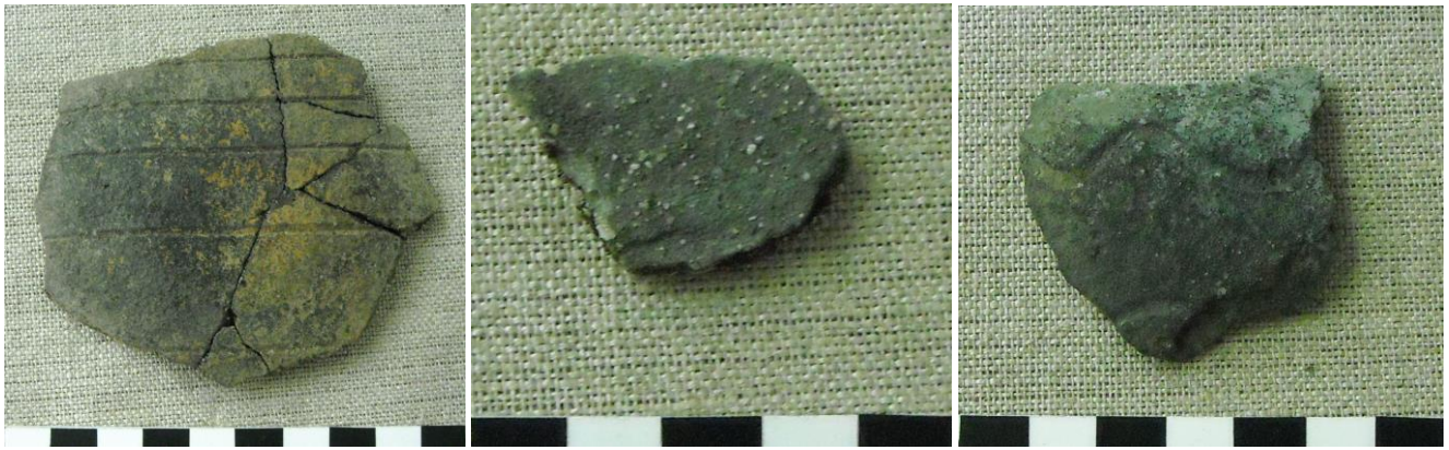
13. kép: Vonaldíszítésű sűrű fazéktöredék; 14. kép: Vonaldíszítésű sűrű fazéktöredék; 15. kép: Hullámsoros sűrű fazéktöredék

Az itteni kerámiatöredékek az összes eddigi (szántóföldön előkerült) cseréptöredékekkel ellentétben, szélein friss törésfelületűek, ami azt feltételezi, hogy a halastó fenékmélyítési munkálatai során törtek össze. Van olyan sűrű korszótöredék, amit 6 darabból ragasztottunk össze, és mindenütt friss törésfelületek keretezik a széleit (13. kép). Ezen egyébként (1cm) sűrűbb és ritkásabb (2 - 2,5 cm) sortávú vízszintes vonaldíszítés található. De előkerült olyan korsó- és fazéktöredék is, amit hullámsoros vonaldíszítéssel készítettek (15. kép).