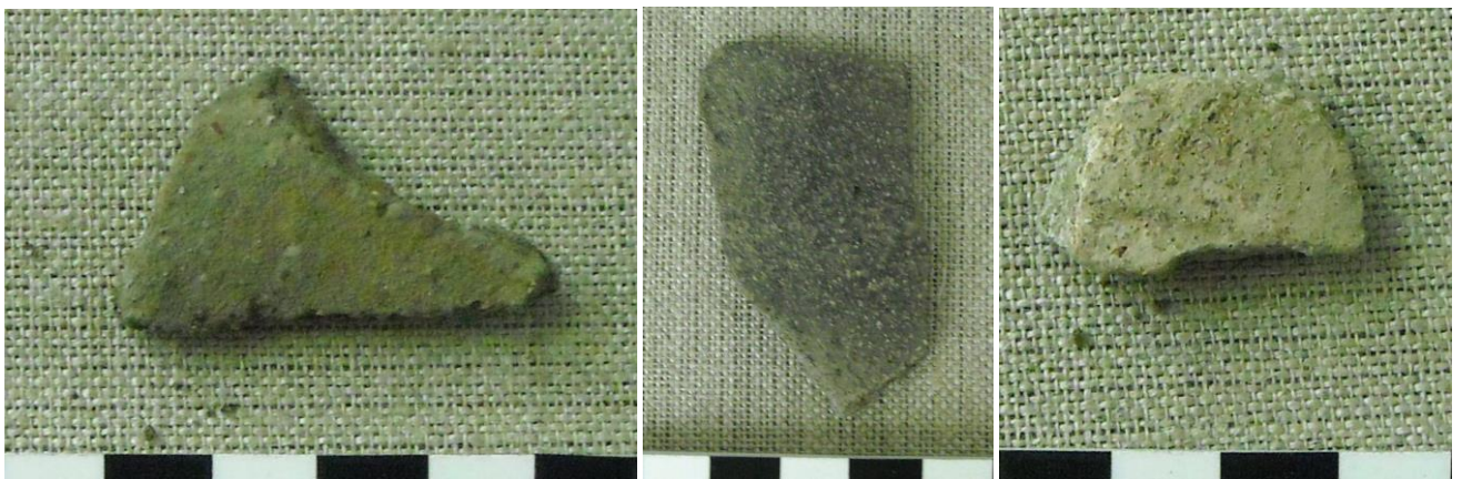
19. kép: Okker színű edénytöredék; 20. kép; Vékonyfalu sűrű korszótöredék; 21. Vonaldíszítésű fehér kerámiatöredék

Az előkerült leletanyag nagyrésze korsó és fazék, kisebb része tál, a korsókat vízfordásra is használták, ami a Gyöngyös patak közelsége miatt indokolt. A halastó keletkezésének időpontját nem ismerjük, de mivel a Festetics sörháznak a tó felőli részét építéskor egy támpillér erősítették meg, feltételezzük, hogy már akkor is (1751) létezett itt a halastó. Festetics József hozta létre a halastó melletti kertészetet is, ami a múlt század hetvenes éveiben is működött még a TSZ. keretein belül. A TSZ. és a halastó között egy kis fahídon lehetett átmenni az ó-kastélyhoz. Az 1857-es kataszteri térkép ennek a gyalogos hídnak a helyén egy nagy hídát jelöl, amin, szekéren is át lehetett hajtani. Csak ezen a hídon lehetett Bozzaiba és Pecölbe menni. Alacsony vízálláskor a Gyöngyös patakban ma is láthatók az egykori híd cölöpjei.