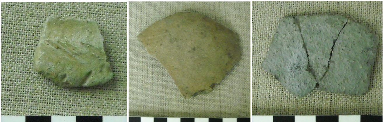
16. kép: Halszálás mintájú fehér fazéktöredék; 17. kép: Okker színű simafalu fazéktöredék; 18. kép; Szürkével festett, vékonyfalu korszótöredék

Az itteni kerámiatöredékek az összes eddigi (szántóföldön előkerült) cseréptöredékekkel ellentétben, szélein friss törésfelületűek, ami azt feltételezi, hogy a halastó fenékmélyítési munkálatai során törtek össze. Van olyan sűrű korszótöredék, amit 6 darabból ragasztottunk össze, és mindenütt friss törésfelületek keretezik a széleit (13. kép). Ezen egyébként (1cm) sűrűbb és ritkásabb (2 - 2,5 cm) sortávú vízszintes vonaldíszítés található. De előkerült olyan korsó- és fazéktöredék is, amit hullámsoros vonaldíszítéssel készítettek (15. kép).