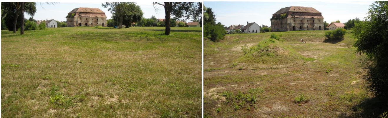
5-6. kép: Az előkerülés helyszíne, a kimélyített halastó

Eddig is sejtettük, hogy az egykori Festetics sörház melletti magaslat (Szécseny belterületének legmagasabb pontja) rejt a föld alatt Szécseny középkorát. A tőle nem messze lévő plébániaudvaron, a szoborpark szobrainak alapásásakor már került elő néhány szórvány kerámiatöredék ebből az időszakból.