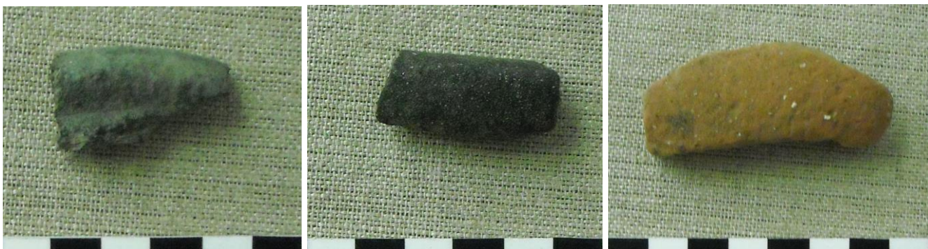
25-26. kép: Fekete színű tálak peremtöredékei; 27. kép: Cserépedény töredéke

A kerámiaanyag sokszor szemcsés, kvarchomokos összetételű, a falvastagságuk a 2,5 mm-től 4-5 mm-ig változik, némelyik belül, néha kívül is szürke festésű.