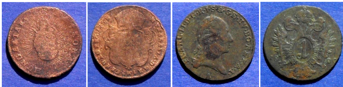
52-55. kép – A káptalan vendégfogadójának (a későbbi Stóger vendéglő) telkén előkerült krajcárok