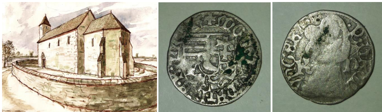
41. kép – Rekonstrukciós rajz a középkori templomról, a hajó tetőzete még ennél is meredekebb és magasabb lehetett, a szentélynél nem voltak támpillérek; 42-43. kép – A káptalan hajdani faiskolája telkén talált Mátyás király ezüstgaras