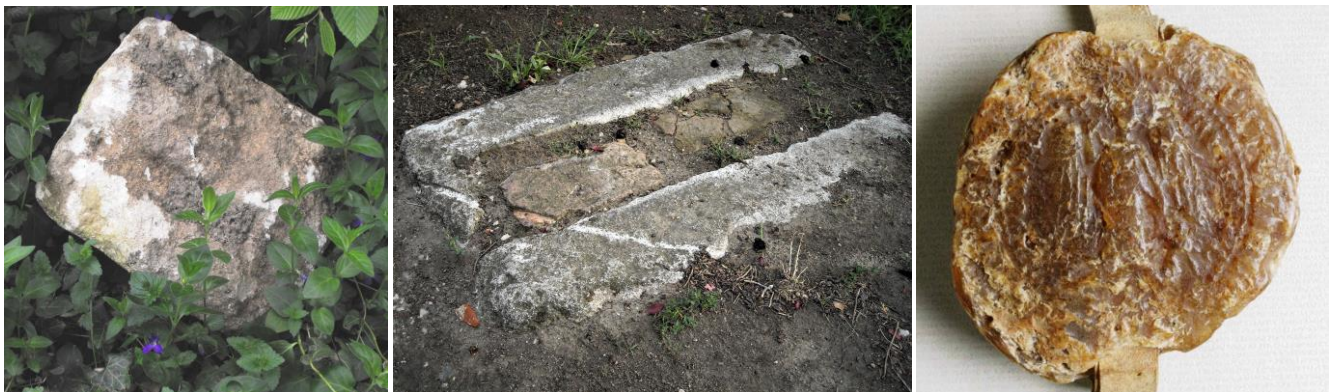
31. kép - Egy római kori épületekő a templom körül elbontott cinteremfalból; 32. kép - Az elbontott cinteremfal kapupilléreinek alapja egy római sírkőtalapzat; 33. kép - A vasvári Társaskáptalan 14. századi pecsétje