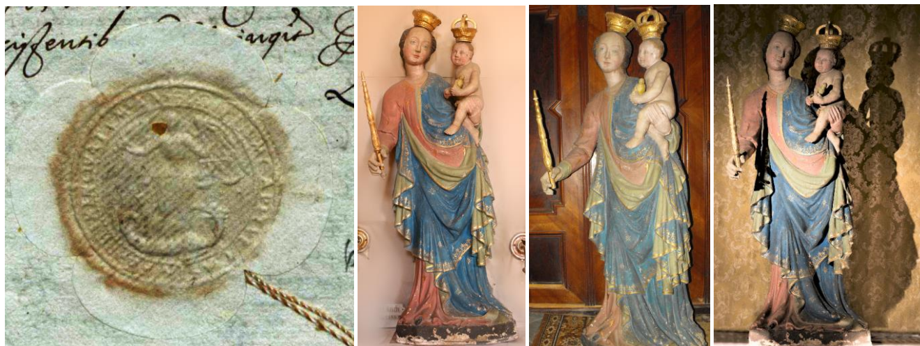
37. kép – A káptalan 15. századi pecsétje; 38-40. kép – A lipárti templom Szép Máriája, cseh páthuzamai ismertek

1587-ben a lipárti Keresztelő Szent János templomnak „oltárigazgatója” volt, tehát olyan személy, aki gondozta az oltárt, oltárokat. Kilenc évvel vagyunk túl a káptalan Szombathelyre való átköltözésén, ami után csak Kenéz és Lipárt maradt meg a birtokában, a többi területe török kézre került.