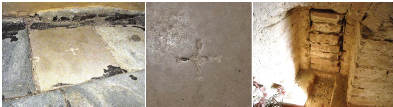
16-17. kép – A régi oltárkő a barokk kórus kövezetében; 18. kép – Befalazott déli ablak a toronyban

A 2000-es felújításkor egy keskeny lőrészzerű mérműves ablaktöredék került elő a nyugati falon, illetve az északi falon egy befalazott halottkivívó kapu. (Az utóbbit sajnos nem tárták fel és nem mutatták be.) A felújításkor az is nyilvánvalóvá vált, hogy a templom mai alaprajza megegyezik az építési alaprajzzal, a középkori falak legtöbbszörre a párkányig ma is állnak, csupán a torony esetében nem igaz ez, ott ugyanis a barokk átépítés során, az előtte már romos állapotú tornyot majdnem az alapig visszabontották. 1333-ban magát a Lipárd-i templomot említik meg egy okiratban, 1367-ben Liphart-ként említik a falut.