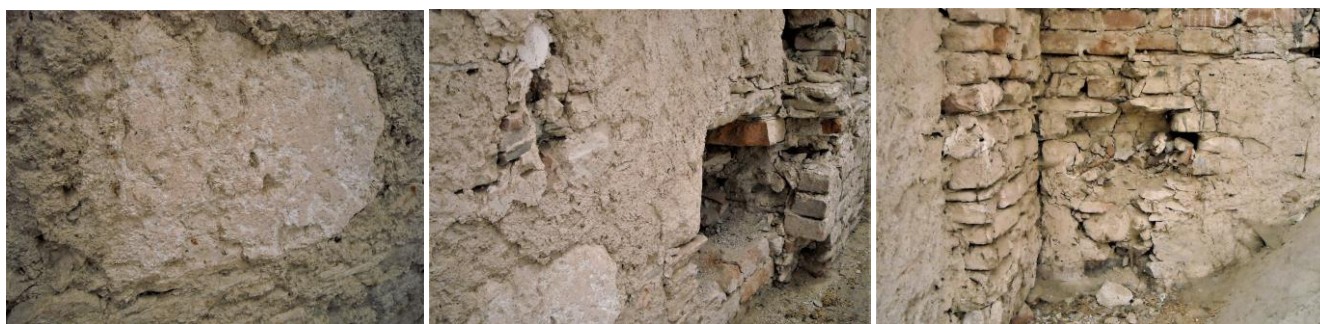
22-23. kép – Római épületkő a padlástér északi falában; 24. kép – A diadalív feletti fal a padlástér északi oldalán

1410-ben egy oklevél megemlíti Lipártot Bárdos szomszédságában. 1426-ban vette meg a káptalan a szomszédos Koltát, és így Kenézzel és Lipárttal együtt egy összefüggő birtoktest alakult ki ezen a környéken, amiből később Lipárt központtal egy önálló uradalmat tudott létrehozni. 1482-ben Mátyás király elé vitték a káptalan lipárti és mileki hatalmaskodásainak az ügyét, 1501-ben Sitkei Gergely vármegyei alispán vezetésével a káptalan vizsgálatot indított egy lipárti jobbágy panasza miatt. Egy 1549-ből fennmaradt dokumentum szerint a lipárti adóegység nagyobb volt (27), mint a szécsenyi (26), pedig ekkor Szécseny már az az enyingi Török család birtokolta (Császtot is, aminek 13,5 volt az adóegysége). Tehát, Lipárt a 16. század közepén még nagyobb falu volt Szécsenyénél, aminek ebben az időben még nem volt temploma. (A császi temető helyét ma a Császtbánya melletti Harangláb dűlőnév őrzi.)