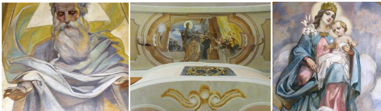
68. kép – Az Atyaisten, secco a szentély mennyezetén (részlet); 69. kép – Szent Cecília, secco a kórus felett; 70. kép – Patróna Hungariae, secco a szentély mennyezetén