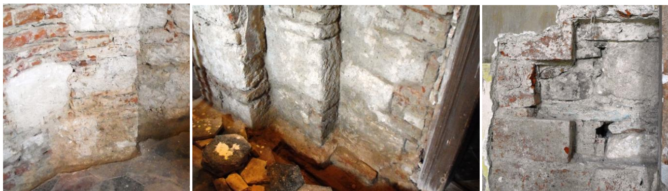
10. kép - Falpillér és falrészlet a szentély déli falán másodlagosan felhasznált római kori épületkövekkel; 11. kép - A régi járósínt a szentély és a sekrestyeajtó alatt; 12. kép - A barokk kőpenyfal alatt a középkori fal a hajó északi oldalán

A templom falazása belső pillérekkel tagolt, ami várfalépítkezési megoldás, mintha nem is templomot, hanem várat akartak volna építeni. A temető és a templom kisebb magaslapon helyezkedik el, a Gyöngyös patak egy mellékága régen Nyugatról is megkerülte ezt a kiemelkedést, természetes vízvédelmet biztosított annak. A templomot hajdan cinteremfal vette körül, amit a múlt század közepén bontottak el. Mivel ez meghatározta a temető nagyságát, arra is van adat, hogy kőből faragott osszáríum is volt a temetőben, a korábbi sírok csontmaradványait ebbe gyűjtötték össze. A templom szentélye körülbelül akkora, mint a száz évvel korábban épült Csemeszokpácsi templom, a lipárti templom hajójába pedig legalább ötször befér ez a szomszédos Árpádkori templom.