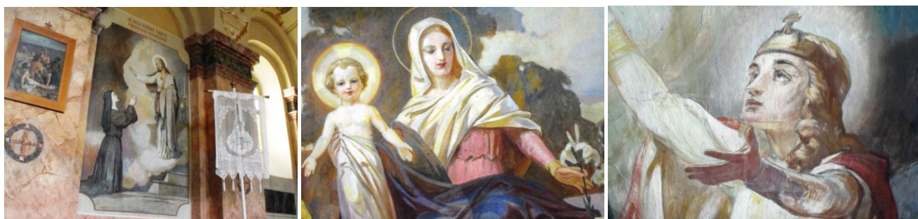
71. kép – Alacoque Szent Marfit, secco a hajó északi falán; 72. kép – Szent család, secco a hajó mennyezetén (részlet); 73. kép – Szent Imre szüzességi fogadalma, secco a szentély északi falán (részlet)