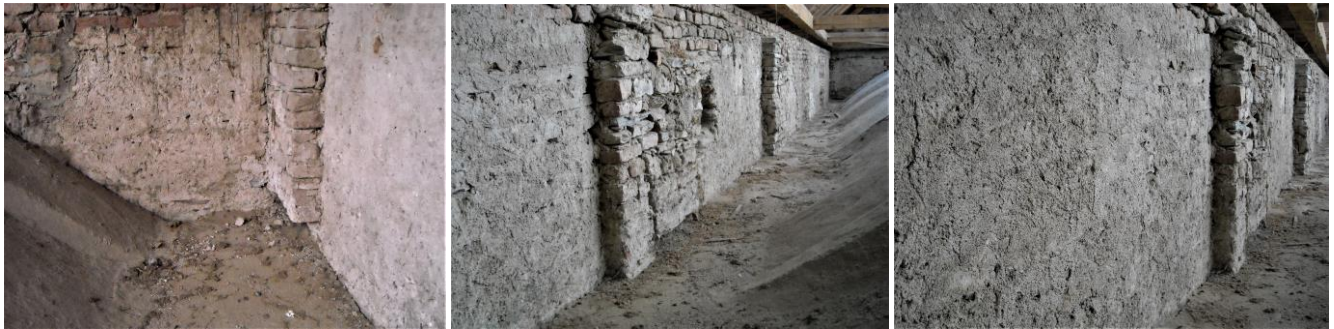
25. kép - A diadalív feletti padlásrész déli oldala; 26-27. kép - Falpillérek a padlástér déli falán, az utolsó két falpillért később lefaragták, elől óriási középkori vakolt felület