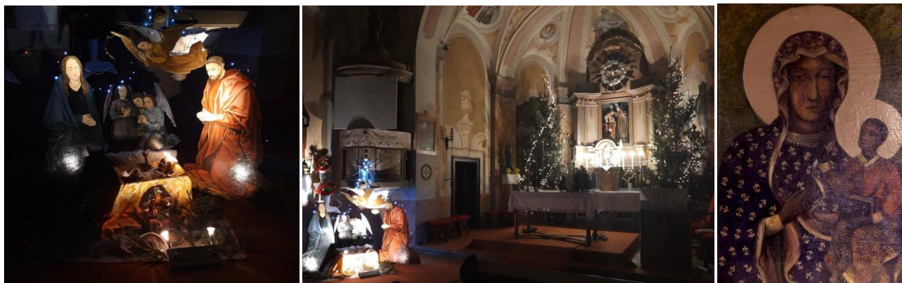
84. kép – A Múltidéző szerkesztője által festett Betlehem karácsonykor; 85. kép – Karácsonyi fényben a szentély és a Betlehem; 86. kép A Múltidéző szerkesztőjének festménymásolata a czestochowai kegyképről

Templomunk néha nagyon magára maradt és elárvult, sokszor már romos állapotban is került. Nem is olyan régen, pár évvel ezelőtt, felmerült annak gondolata is, hogy örökre bezárják. Különösen a profetikus lelkületű plébánosok ragaszkodtak hozzá, kiknek Keresztelő Szent János a példaképük volt.