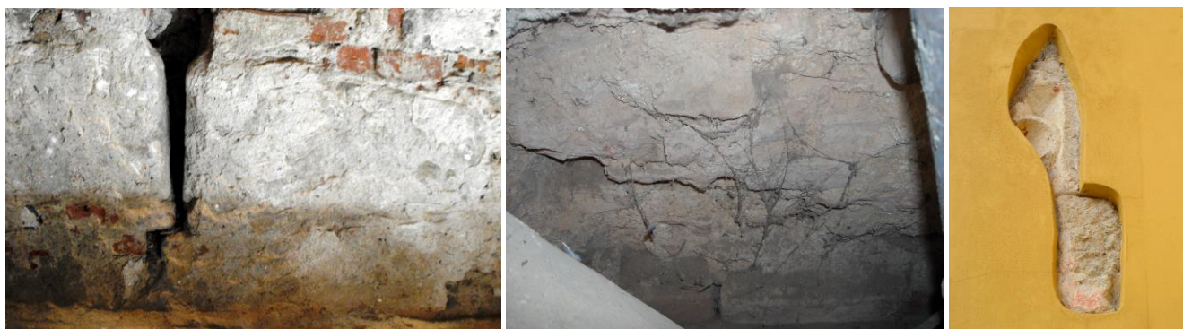
13. kép - Tektonikus repedés a szentély déli falában; 14. kép - A toronyban a középkori falrész; 15. kép - Az ablaktörődék a déli falon

A következő megválaszolatlan kérdés tehát az, hogy száz év alatt mi változott akkorát, hogy ennyivel nagyobb templom épült Lipárton? Szinte egy akkori városi templom méreteivel vetekszik a templomunk. A helyben lévő, szinte korlátlan mennyiségű építőanyag (a Papkerti római kori villa, esetleg katonai tábor, vagy templom), vagy a Ják nemzetség anyagi helyzete determinálta mindezt?