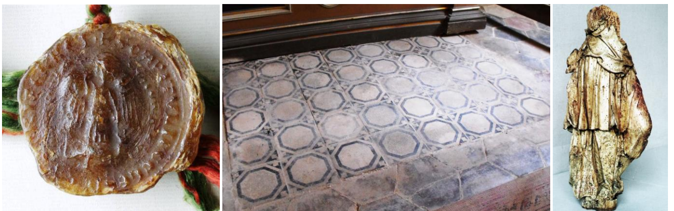
34. kép - Avasvári Társaskáptalan 15. századi pecsétje; 35. kép - Az egykori Szűz Mária szárnyasoltár helye a templom szentélyében a mai oltár előtt; 36. kép - A 2000-es felújításkor a padlástérben talált szobortöredék a szárnyasoltárról