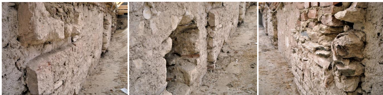
19-21. kép – A tetőtérben a középkori falpillérek az északi falon, jól látható az egykori famennyezet szintje. Még ebben a magasságban is rengeteg római épületkő található a falban