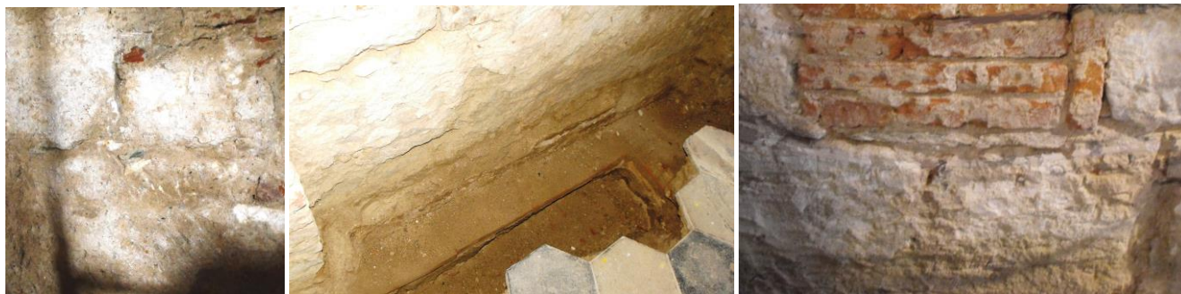
7. kép - Római kövek a szentélyben; 8. kép - A régi járósínt a mai alatt a szentélyben; 9. kép - Befalazott pasztofórium a szentély déli falán

Tana temetője a falutól Keletre van, Lipárté a falutól Nyugatra, Mileké pedig ismét a falutól Keletre volt. Mit jelenthetnek ezek a tájolási különbségek? Lipárton a múlt századik fennmaradt a temető környékének népi neve: Bárnevóna ( Vas megye földrajzi nevei ), ami a halál elkerülhetetlenségét fejezi ki, ez is középkori eredetre utal. A Vögykert kifejezés újabb keletű, a káptalan későbbi kertészetére utal.