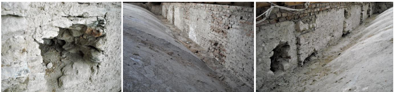
28. kép - Az 1834-es felújításkor a bontásokba mestergerendát helyeztek és vaspántokkal rögzítették a beázások miatt megroggyant boltozatot, a barokk boltozat alacsonyabb volt a mostaninál; 29. kép - A padlástér déli falrésze; 30. kép - A padlástér északi falrésze