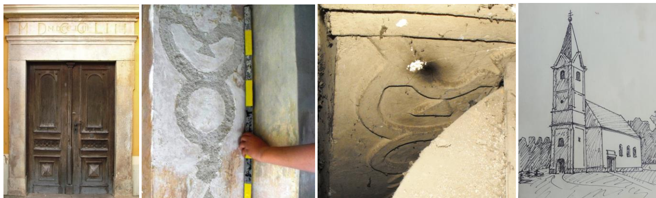
48. kép - A barokk nyugati kapu; 49-50. kép - Lefaragott barokk stukkódíszítés a szentély pillérén, illetve megmaradt állapotban az oltár mögött; 51. kép - A barokk templom, rekonstrukció

A templom átépítésekor került a templom birtokába egy bécsi ezüst kehely, gerezdes talpa vízszintesen tagolt, hátoldalán baluszter, felirata: Exasdo D. Franc Pázmándi C.C.C. Eccl. Lipart aug. 1755. (Ezt a barokk szobrokkal együtt a későbbi két betörés alkalmával ellopták). Egy aranyozott réz monstancia 1757-ből, ellipszis alakú talpán kagylódísz, a szentségtartó körül többszörös keret kagylódísszel, álékkövekkel, és Káldi György által fordított Szent Biblia 1732-ből.