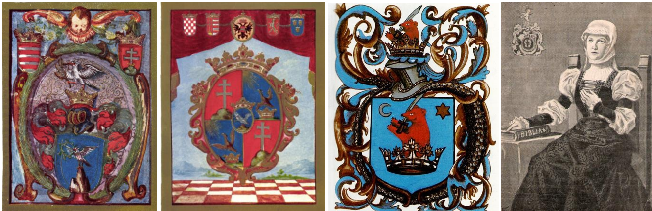
10. A Széchenyi család 1629-es címre; 11. kép - A Széchenyi család 1687-es címre; 12. kép - Az enyingi Török család címre; 13. kép - Török Ferenc édesanyja, Pemmflinger Katalin

Itt térünk át először a Széchenyi család genealógiájára, amit Bártfai Szabó László dolgozott fel alapos, 824 oldalas művében (A Sárvári Felsővidéki Széchenyi család története - 1911 Bp.) Ebben olvashatjuk: „A levéltárt hosszú évtizedeken át Sopronban őrizték, bajos volt az iratokhoz hozzáférni, amelyek többszörös viszontagságon esvén át épp a leszármazásra, a család korábbi történetére nézve alig tartalmaznak valamit. Azon írók tehát, kik a kérdést bolygatták, kevés eredményt tudtak felmutatni, többnyire egymást ismételték. Az első író, ki a Széchenyiekről rövid életrajzi vázlatok alapján megemlékezett, Lehoczky András volt, 1798-ban megjelent Stemmatographiájában a többi nemes család között a Széchenyieknek is szentel néhány sort, a család első ősének Mihály veszprémi kapitányt, Márton atyját tartja a család grófi oklevele, illetőleg annak Istvánffy munkájára való hivatkozás alapján. Széchenyi György és Pál érsekekről csak néhány sorban közöl kevés adatot, amelyek végén szó szerint közli III. Ferdinánd 1651. augusztus 31-én és szeptember 18-án Széchenyi György érsekhez intézett levelét, melyekben a király megköszöni a szentgróti, pápai és veszprémi katonáknak adott segítséget.” (9)