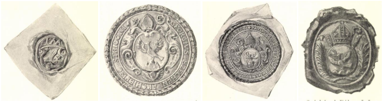
14. Kép - Széchényi Mihály pecsétje 1566; 15. kép - Szécsényi György esztergomi érsek pecsétje; 16. kép - Széchényi Pál veszprémi püspök pecsétje; 17. kép - Széchényi Pál veszprémi püspök gyűrűs pecsétje

„Úgy terjedelmre, mint tartalomra nézve a megelőzőknél többen ír a Széchényiek korai történetéről Fraknói Vilmos, mintegy bevezetés gyanánt Széchényi Ferenc életrajzához. Közli a nemesi oklevél fénynyomatú hasonmását, ennek és a grófi oklevélnek képeit, bővebben foglalkozik Széchényi György és Pál érsekek életével, a családi vagyoni viszonyaival. A leszármazásra nézve teljesen Nagy Iván véleményét osztja. A grófi oklevél kitétele a mű szerzője szerint alaptalan, Mihály nem fogadható el a család ősenek, az érsek atyja, Széchényi Márton nem volt nemes ember, nem is Széchényinek, hanem Szabónak hívták.” (13)