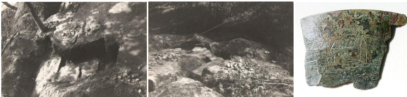
26-27. kép – Az enyingi Török család szécsenyi udvarházának alapjai kutatóárkokban az ó-kastély felújításakor; 28. kép – Rézkehely töredék a Gyöngyös oldalági kiszáradt medréből az új-kastélynál

Végezetül idézzünk el egy kicsit a Széchenyi család Sárvár felsővidéki előnevénél, habár ez már csak amolyan gondolatjáték, hisz itt sokkal egzaktabb tényekkel állunk szemben, mint a genealógiában. Ez a birtoktest a Széchenyi családhoz közvetve, a kincstáron keresztül került Nádasdy Ferenc hűtlensége után, birtokfosztása következtében. A Sárvári vár és a hozzátartozó Alsó és Felsővidék „Lipót király 1677. június 8-án Laxenburgban kiadott oklevele szerint megfontolván a Draskovich család érdemeit, főleg Drakovich Miklós gróf, királyi főajtónálló szolgálataiért” (Id. m. 446) lett adományozva a Draskovich családnak, majd a Széchenyi családhoz került.