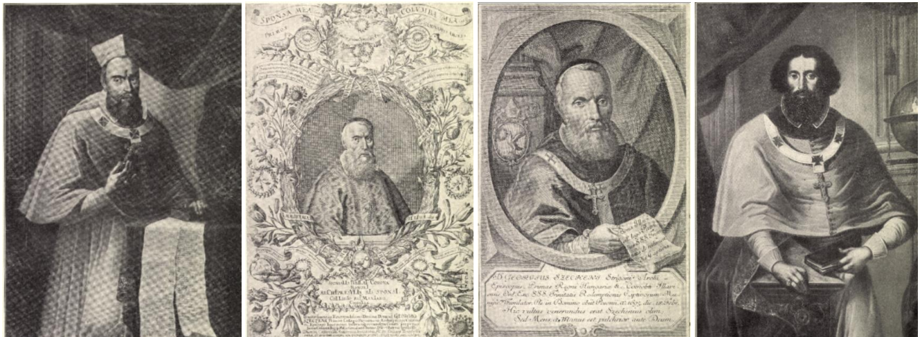
22. kép - Széchényi György esztergomi érsek; 23. kép - Széchényi György esztergomi érsek 1681; 24. kép - Széchényi György esztergomi érsek 1693; 25. kép - Széchényi Pál kalocsai érsek