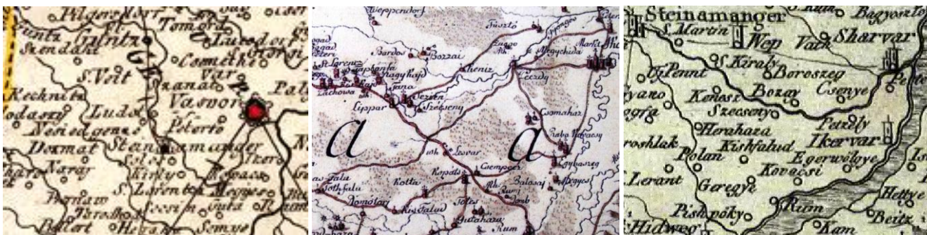
32. kép - Johan Franz Josef von Reilly térképe 1789; 33. kép - 1790-es térkép; 34. kép - Franz Müller térképe 1792

Itt kell megemlíteni, hogy Szécseny a középkor során egy ideig a sárvári vár uradalmi közé tartozott. 1386. január 15-én, a vasvári ispán fellebbezésének következtében Mária királynő megbízottjai Zsidóféldéért (Vasvár melletti) cserébe a sárvári királyi várhoz tartozó Császtot (Parva villa Chazth Castri Saruar) és Szécseny (Parca villa Scechen Castri Saruar) jelölték ki a vasvári káptalan számára. (Az adománylevél a két falura 9 egész jobbágytelket, 48 kaput és 2 malomházat említ, az utóbbit úgy tudjuk értelmezni, hogy Császt Gyöngyösmenti, vagy mellékági részén is volt malom, de úgy is, a mileki malomhoz hasonlóan a szécsenyi malom is kétkerekű volt.) Tehát Szécseny egy időben ehhez a Sárvár Alsó és Felsővidékhez tartozott, igaz a Nádasdyak alatt ez az állapot már nem állt fenn.