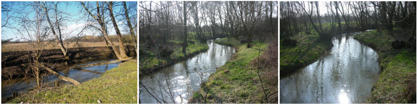
7. A Gyöngyös patak, egy régi fahíd megmaradt gerendáival az ó-kastélynál; 8-9. kép - A Gyöngyös patak Szécsényben

Itt térünk át először a Széchenyi család genealógiájára, amit Bártfai Szabó László dolgozott fel alapos, 824 oldalas művében (A Sárvári Felsővidéki Széchenyi család története - 1911 Bp.) Ebben olvashatjuk: „A levéltárt hosszú évtizedeken át Sopronban őrizték, bajos volt az iratokhoz hozzáférni, amelyek többszörös viszontagságon esvén át épp a leszármazásra, a család korábbi történetére nézve alig tartalmaznak valamit. Azon írók tehát, kik a kérdést bolygatták, kevés eredményt tudtak felmutatni, többnyire egymást ismételték. Az első író, ki a Széchenyiekről rövid életrajzi vázlatok alapján megemlékezett, Lehoczky András volt, 1798-ban megjelent Stemmatographiájában a többi nemes család között a Széchenyieknek is szentel néhány sort, a család első ősének Mihály veszprémi kapitányt, Márton atyját tartja a család grófi oklevele, illetőleg annak Istvánffy munkájára való hivatkozás alapján. Széchenyi György és Pál érsekekről csak néhány sorban közöl kevés adatot, amelyek végén szó szerint közli III. Ferdinánd 1651. augusztus 31-én és szeptember 18-án Széchenyi György érsekhez intézett levelét, melyekben a király megköszöni a szentgróti, pápai és veszprémi katonáknak adott segítséget.” (9)