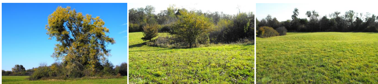
4-6. kép – A Berek és Kastélyalja Szécsenyben