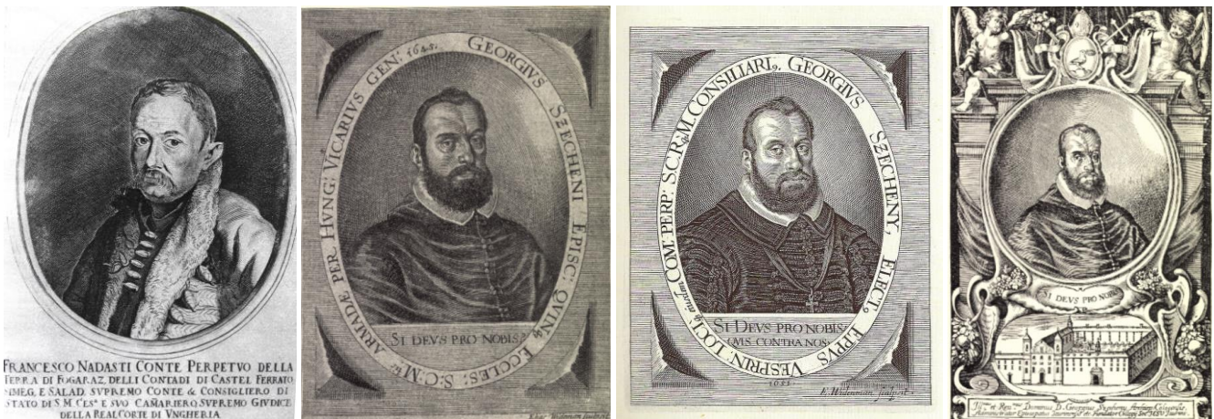
18. kép - Nádasy Ferenc, 19. kép - Széchényi György pécsi püspök 1645; 20. kép - Széchényi György veszprémi püspök 1666; 21. kép - Széchényi György kalocsai érsek 1667

„Úgy terjedelmre, mint tartalomra nézve a megelőzőknél többen ír a Széchényiek korai történetéről Fraknói Vilmos, mintegy bevezetés gyanánt Széchényi Ferenc életrajzához. Közli a nemesi oklevél fénynyomatú hasonmását, ennek és a grófi oklevélnek képeit, bővebben foglalkozik Széchényi György és Pál érsekek életével, a családi vagyoni viszonyaival. A leszármazásra nézve teljesen Nagy Iván véleményét osztja. A grófi oklevél kitétele a mű szerzője szerint alaptalan, Mihály nem fogadható el a család ősenek, az érsek atyja, Széchényi Márton nem volt nemes ember, nem is Széchényinek, hanem Szabónak hívták.” (13)