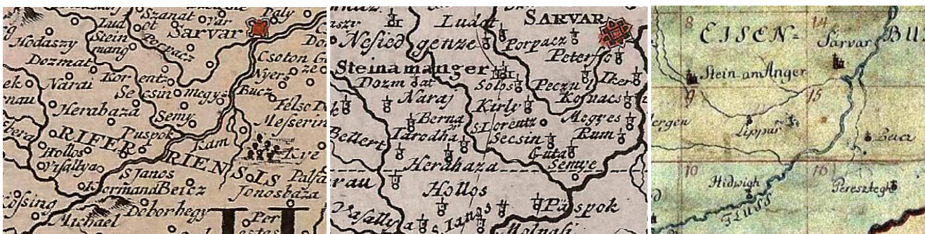
29. kép - Peter Schenk térképe 1717; 30. kép - Johann Baptist Homann térképe 1718; 31. kép - Osztrák katonai térkép fedele 1782-5

Végezetül idézzünk el egy kicsit a Széchenyi család Sárvár felsővidéki előnevénél, habár ez már csak amolyan gondolatjáték, hisz itt sokkal egzaktabb tényekkel állunk szemben, mint a genealógiában. Ez a birtoktest a Széchenyi családhoz közvetve, a kincstáron keresztül került Nádasdy Ferenc hűtlensége után, birtokfosztása következtében. A Sárvári vár és a hozzátartozó Alsó és Felsővidék „Lipót király 1677. június 8-án Laxenburgban kiadott oklevele szerint megfontolván a Draskovich család érdemeit, főleg Drakovich Miklós gróf, királyi főajtónálló szolgálataiért” (Id. m. 446) lett adományozva a Draskovich családnak, majd a Széchenyi családhoz került.