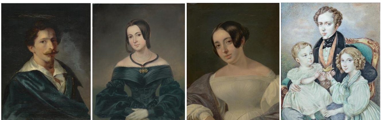
51. kép - Férfiportré, olaj 1836; 52.kép - Női portré, olaj 1838; 53. Női portré, olaj 1936; 54. kép - Családkép, elefántcsont, tempera

A szécsenyi templom oltárképére valamiért eddig nem figyelt fel igazán a művészettörténeti kutatás, és alkotója sem nagyon ismert idehaza. Pedig felszentelése pillanatában, 1837-ben, a szécsenyi templom nagyszerű stílusjegységet valósított meg, építészetileg a klasszicizmushoz tartozott, belső díszítőfestészete a copf stíuselemeit is felmutatva biedermeier hatás alatt született, különösen a képtükrök motívumai, festői megoldásai. Azonban vitathatatlanul a templom legszebb ékessége Lütgendorf monumentális oltárképe volt, hála Ebergényi Benedek jó ízlésének, műveltségének. Értékeinket ideje jobban megismerni és legfőképp megbecsülni.