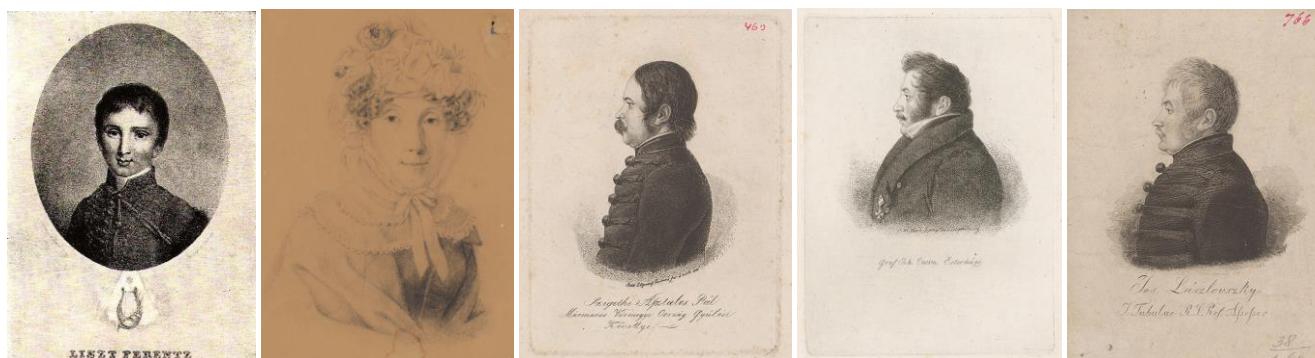
13. Liszt Ferenc portréja 1826; 14. kép - Női portré, ceruzarajz 1926; 15-17. kép - Diétai követek portréi, rézkarcok 1826