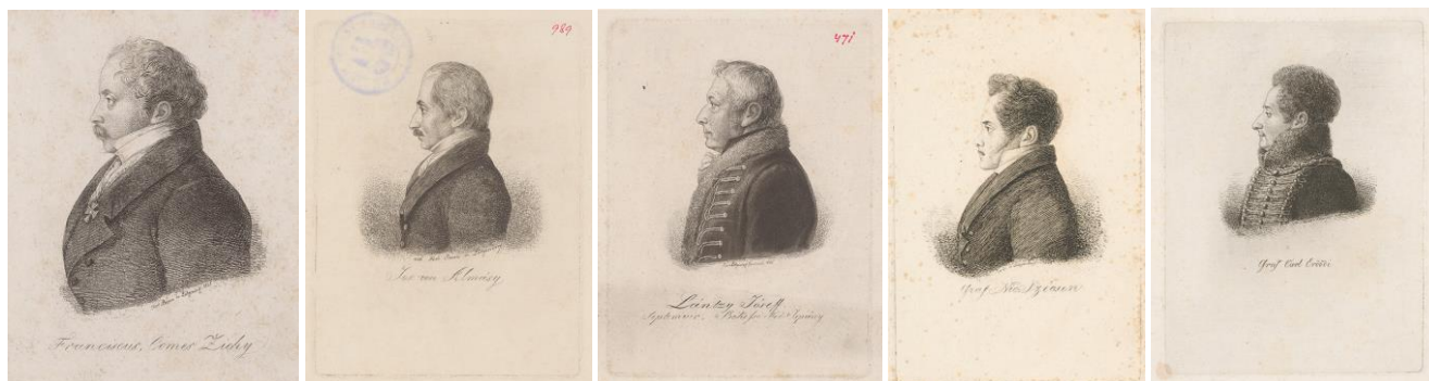
18-22. kép - Diétai követek portréi, rézkarcok 1826