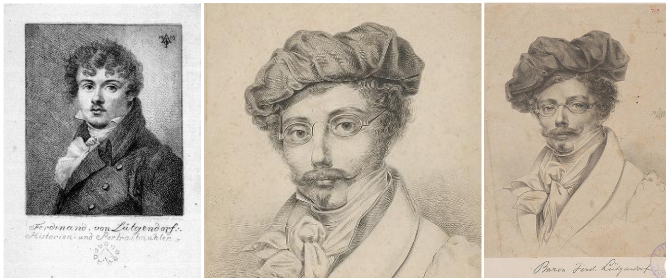
7. kép - A művész rézkarc önarcképe 1810-ből; 8-9. kép - A művész önarcképei

Böle András 1841-es vizitációjából tudunk meg a legtöbbet az oltárképről: „Ekkorig csak egy főoltár vagyon benne, és a falon függő aranyos rájával díszített Nagy Boldog Asszony képe, Pozsonyban lakozó Báró Lütgendorf által rajzoltatott 400 forintért. Oldalon a széltől függ szinte egy aranyos rájában Szt. István jó magyar királyt ábrázoló jeles kép, melyet többször említett T. Ebergényi Benedek édesatyjának, Nagy Ebergényi István királyi tanácsosnak örök emlékére saját költségén bécsi rajzoló Fischer Ignác által készíttetett.”