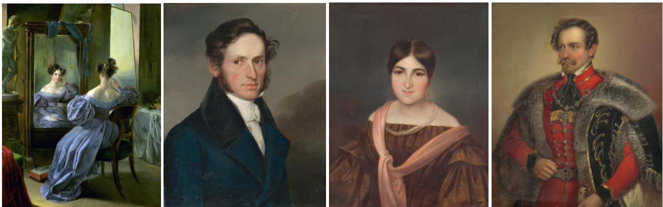
47. kép - Nő a tükör előtt, olaj 1934; 48.kép - Férfi portré, olaj 1832; 49. Női portré, olaj; 50. kép - Férfi portré, olaj 1837

Lütgendorf az 1830-as évek közepén volt a pályája csúcán, Ebergényi Benedek épp ekkor kereste fel a megbízással. Olajfestmény portréi átgondolt kompozíciók, biztos rajztudásról árulkodnak, pontos megfigyelésekre épülnek, markáns kifejező erővel rendelkeznek. Színben visszafogottak, általában szürkével megtörték, érzelmi tartalommal bírnak, női portréi kifejezetten meghittek, kedvesek. A drapériák anyagszerűek, a többalakos kompozíciói viszont nehézkesek, kivéve, mint a szécsenyi templom oltárképe esetén, ha nem klasszikus nagy mesterek műveinek másolatai.