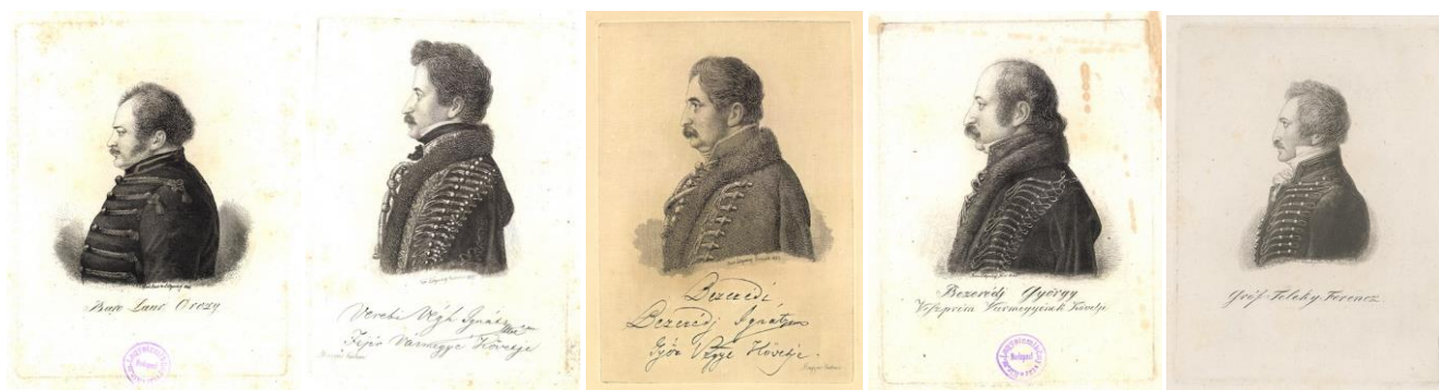
38-42. kép – Diétai követek portréi, rézkarcok 1828-29