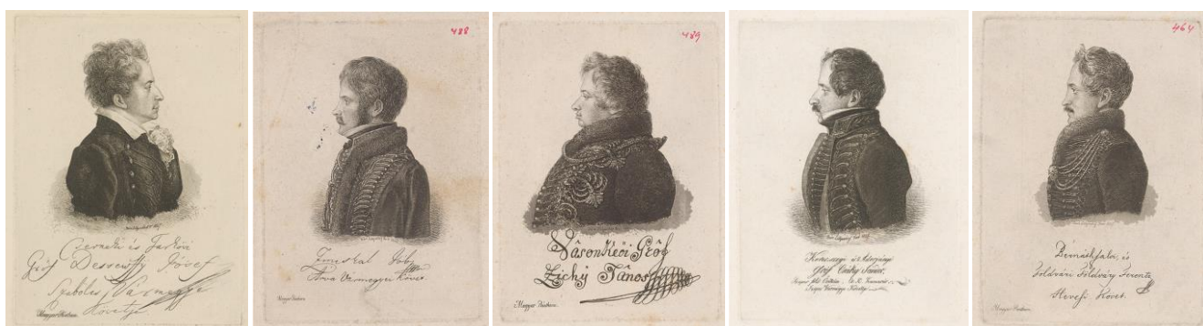
28-32. kép – Diétai követek portréi, rézkarcok 1827