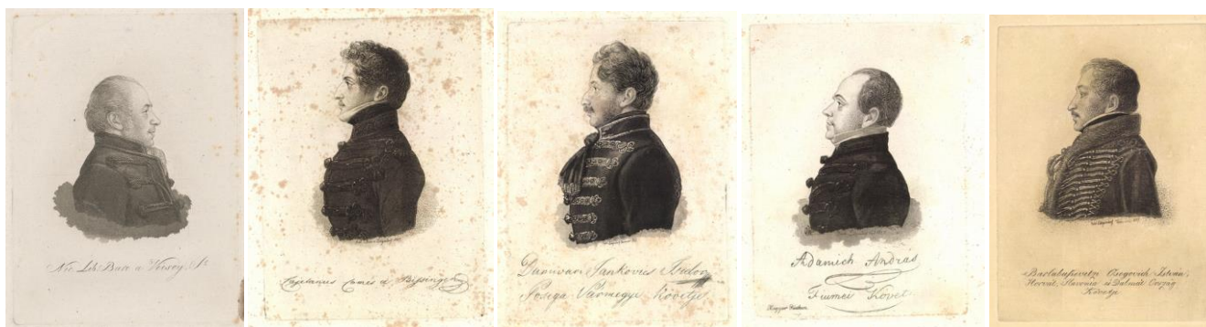
33-37. kép – Diétai követek portréi, rézkarcok 1828