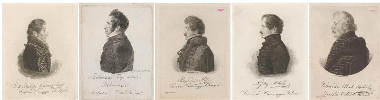
23-27. kép – Diétai követek portréi, rézkarcok 1827

amit biztosan szintén elkészített. (A legtöbb portré a Pozsonyi Szlovák Nemzeti Galériában található, de itt látható a legtöbb olajképe is a művészeknek.) A szécsenyi templom sekrestyéjében lévő Ebergényi Benedek portrén olyan fiatal a falu földbirtokosa, hogy akkor valószínűleg még nem volt országgyűlési követ, így annak alkotójában ne keressük a festő keze nyomát.