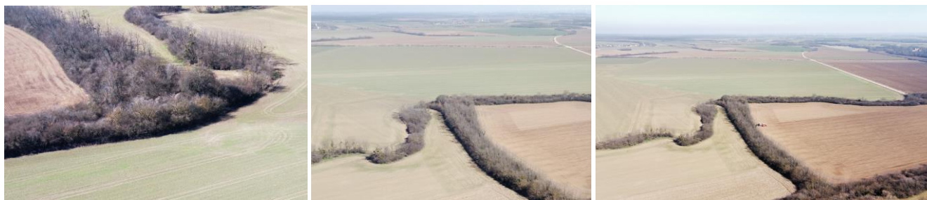
16. kép - Légi felvételek a Papkertenél a kiszáradt Gyöngyösmeder kanyarról; 17-18. kép - Légi felvétel a most kitisztított kiszáradt Gyöngyösmederről, a kanyar után a kb. 50 méteres egyenes fürdő-szakasz, és a Gyöngyössel összekötő mesterséges csatorna

templom építéséről fennmaradt legenda szerint innét, erről a területről hordták át az angyalok 3 egymás utáni éjszaka a templom építőanyagát a templom mai helyére. Ez győzte meg végül az építőket, hogy ide kell építeni a templomot.