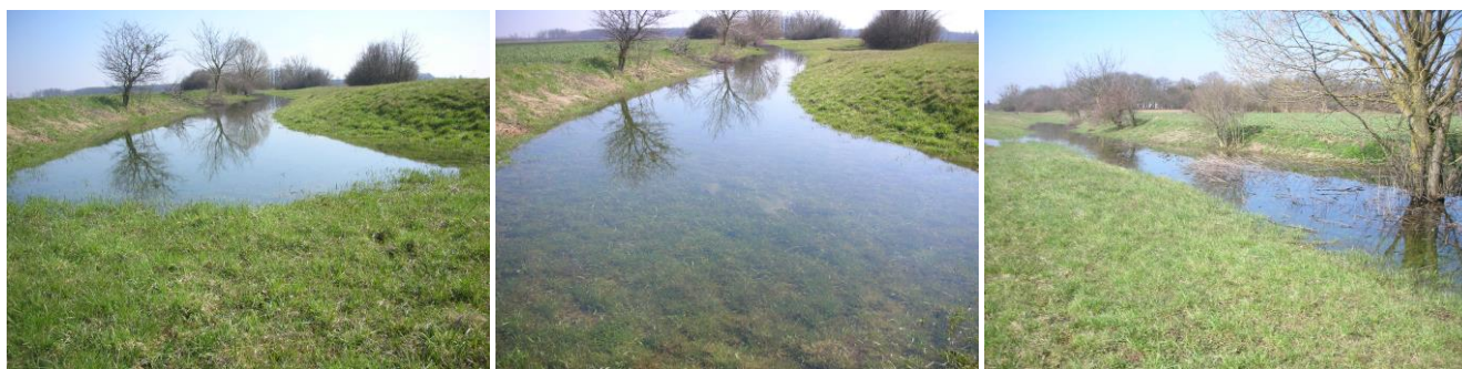
25-27. kép – A Kenderáztató, ami valójában egy kiszélesített egykori Gyöngyös meder volt

Egy korábbi csapadékosabb tél után ez a Kenderáztató is feltelt vízzel, a közölt képek ekkor készültek (22-24. kép). Egyben ezek a fényképek segítik elképzelni azt, hogy évszázadokkal korábban milyenek is lehettek ezek az oldalágak, amik ma kivétel nélkül mind kiszáradtak.