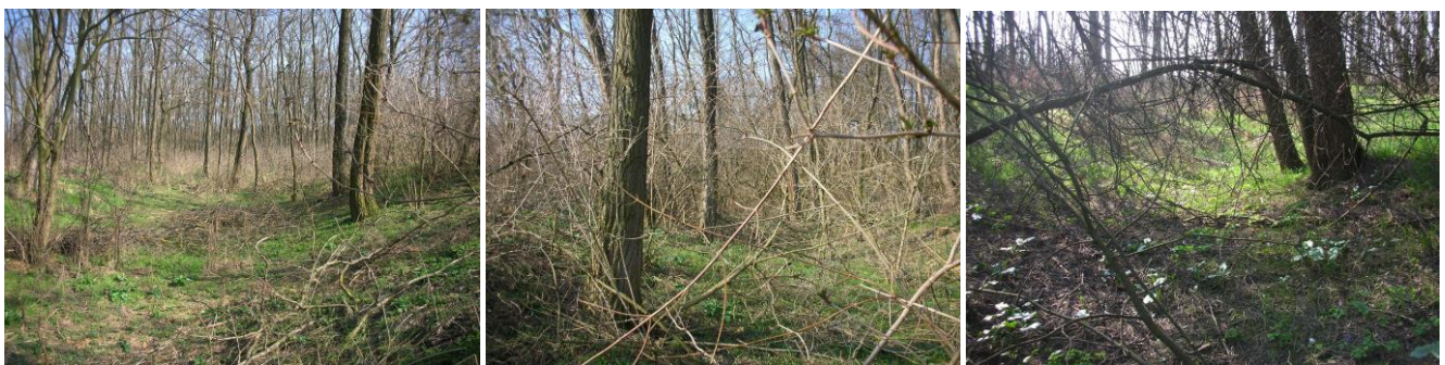
13-15. kép - A Szere fái közt tovább megy Szécseny felé a kiszáradt Gyöngyös meder

Az ó-kastély és az új kastély között a szécsenyi részen a Gyöngyös patak jobb partján szintén volt egy oldalág, aminek medre jelenleg is az új-kastély előtt szeli át a bejárati utat, a kastélyt Keletről megkerülve a kastély mögötti a Kenderáztatóba tartott, később Pecöl felé elszántották a medrét. Ezzel az oldalággal együtt alakították ki az ó-kastély környékén az egykor ott állt középkori vízárat. (Vizes-árok-rendszer is volt hozzá, amiből egy kevés még ma is látszik az Ó-Ebergényi kastély mellett.) Régi térképek szerint ez a szécsenyi Gyöngyös-kanyarulat erősen mocsaras, vizenyős terület volt. Nem véletlen, hogy mind Milek, mind Lipárt, és Szécseny is egy-egy magaslatra épült, hogy ezek földvárak voltak előtte, azt csak régészeti feltárásokkal lehetne megerősíteni.