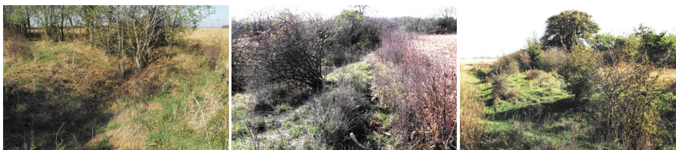
1-3. kép - A kiszáradt Gyöngyösmeder a Papkertenél

Tizenegyedik évfolyamába lép a Múltidéző, önerőből, egyetlen fillér önkormányzati támogatás nélkül. (Sem egyesület, sem önkormányzati képviselő nem támogatta soha.) Ez a tény önmagáért beszél. Egyedül az olvasók hűsége, figyelme, ragaszkodása tartja életben, de épp ezért jött létre. Mostani számunkban szűkebb táji környezetünk „múltidézésével” foglalkozunk, amikor maga a táj tárja fel múltunk régi évszázadait, csak olvasni kell tudni belőle. Ehhez persze kell némi helyismeret és helytörténeti jártasság.