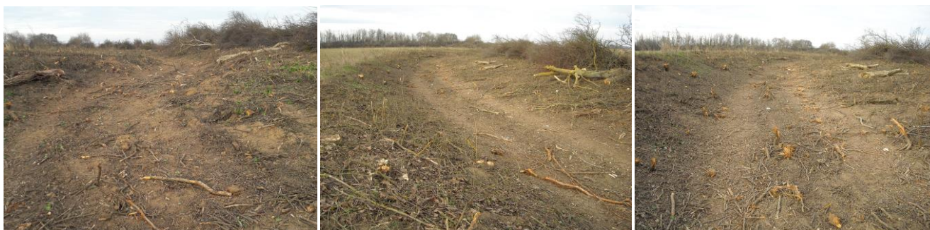
4-6. kép - A most kitisztított, a Papkerttől Délnyugatra fekvő kiszáradt Gyöngyösmeder

Egy középkori határleírásban olvashatunk „kiszáradt Gyöngyös ágról” (1237), amiből több is volt a településünkön. Tana felől a lipárti falurészen Gyöngyös mindkét oldalán volt egy-egy kiszáradt meder, vagy ág. A jobb parti, a mai Völgykert utca vonalán kanyargott a lipárti temetőig és a mostani Trianoni emlékműig, majd a főszőlő kertek alatt a Dobogó híd környékén tért vissza a mai Gyöngyösmederbe. (Valójában így a lipárti templom egy kisebb szigetre épült, egyik oldalt völgykerti ág, másik oldalt a mai Gyöngyös fogta közre.) Ha ehhez hozzávesszük, hogy a múlt század közepén elbontott cinteremfal 20. századig még megmaradt déli részét, akkor egy fallal is körülvelt, erődített templomként tudjuk elképzelni a középkori lipárti templomot. (A templom déli oldalán előkerült lőrösszerű kis gótikus ablaktöredék is ezt bizonyítja.)