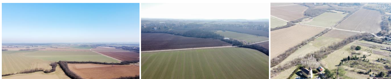
19-20. kép - A kiszáradt Gyöngyös meder a Papkertenél, a Szerénél; 21. kép - A lipárti templommal a Gyöngyös patak, felette a kiszáradt bal parti ága, alatta a kertek alatt kanyargó kiszáradt jobb parti ága