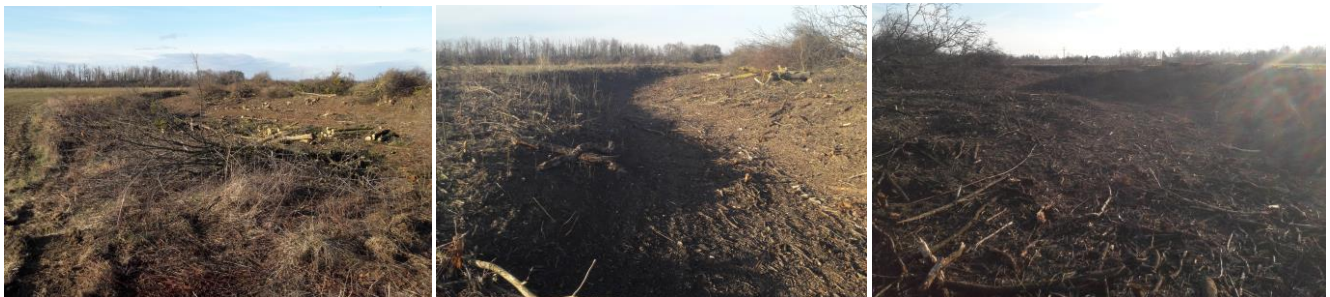
7-9. kép - A most kitisztított kiszáradt Gyöngyös meder, a 9. képen a fürdésre alkalmas partszakasz

Ez a most kitisztított meder a Papkerttől és a Tetőtől Délnyugatra haladt, északi oldalán hosszan elnyúló lapos partszakasszal. Ezt a partszakaszt a Délnyugati napfény világítja meg, emiatt valamikor fürdőzésre alkalmas terület lehetett. Ha a Múltidéző korábbi számaiban felvetett hipotézisre visszatérünk, miszerint a Papkert területén nem egy római villagazdaság, hanem római katonai tábor volt, akkor ez a partszakasz akár fürdőhelye is lehetett (a telet leszámítva) a légiós katonáknak. A meder éles kanyarulatánál (annak bal partján), közvetlen mellette, biztosan épület állt, itt ugyanis rengeteg római kori épületkő és tetőcserép került elő az elmúlt évtizedekben. Talán ez volt a konyha, hisz az ételmezéshez a vízvezetőhelynek közel kellett lennie a patakhoz. (16. kép) A légifelvételeken jól lehet látható (17-19. kép), hogy ehhez a vízvezetőhelyhez az oldalág kiszáradása után egy mesterséges csatornát ástak a Gyöngyös mai medrétől, hogy a vízigényt továbbra is biztosítsák. A patak vizek ebben az időben iható tisztaságúak voltak, ahogy falu határában a két ér (Kis ér, Nagy ér) is, amik mára szintén kiszáradtak.