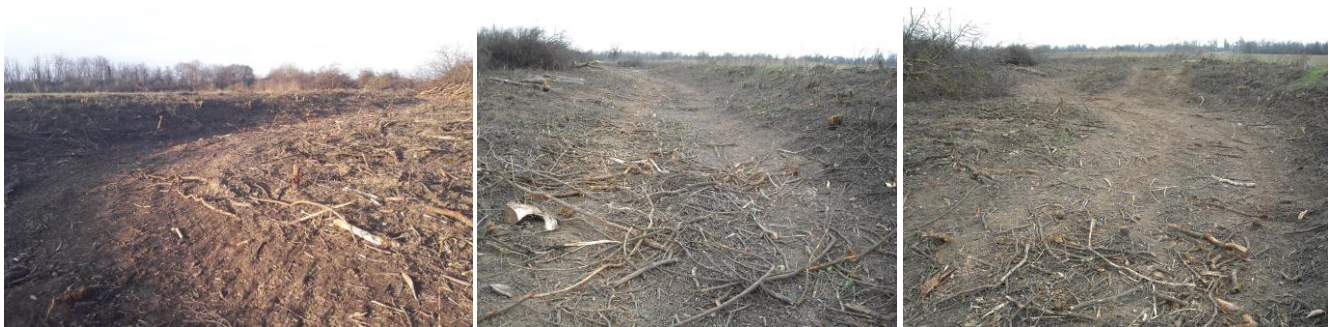
10-12. kép - A most kitisztított kiszáradt Gyöngyös meder, a 10. és 12. képen a fürdésre alkalmas partszakasz