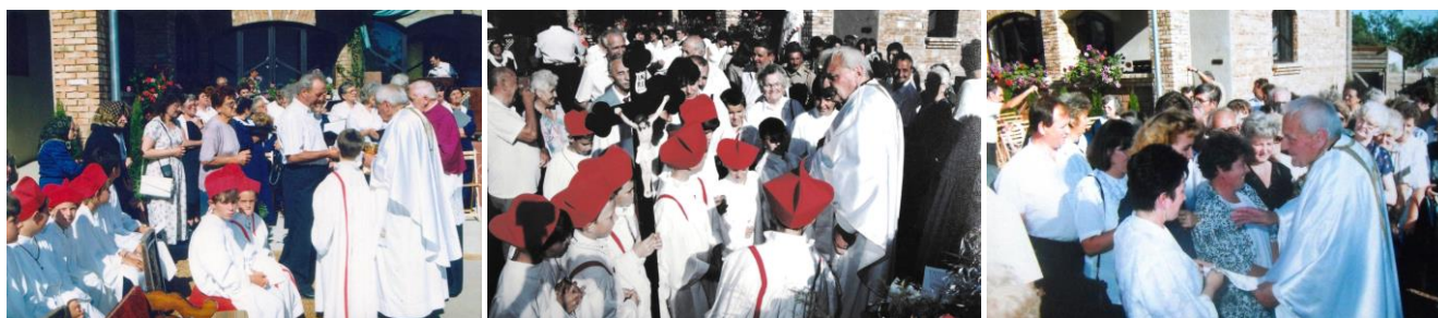
67-69. kép – Aranymiséjén hívei közt 1995. augusztus 13-án