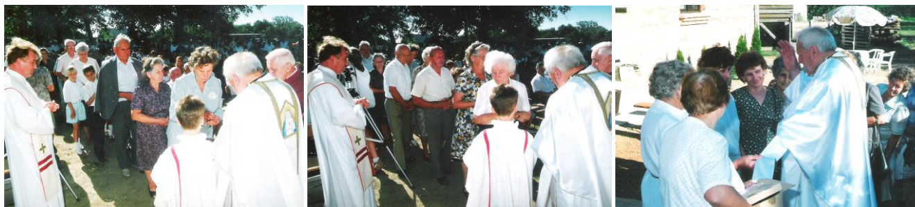
63-66. kép – Aranymiséjén hívei közt 1995. augusztus 13-án, nem csak neki, hanem az egész falunak nagy napja volt, az épülő plébánia udvara igazi népünnepélynek adott otthont