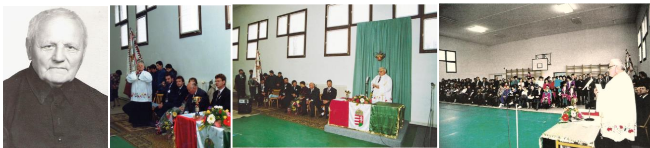
53. kép – Idősen is fiatalon; 54-56. kép – Az új tornaterem felszentelésén 1992-ban