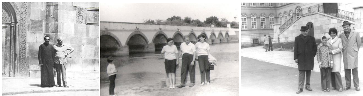
21. kép – Grúziában; 22. kép – A Hortobágyon; 23. kép – Pannonhalmán

1973-ban nevezték ki káplánnak a kanonok úr mellé, a Te továbbtanulásodban volt szerepe?