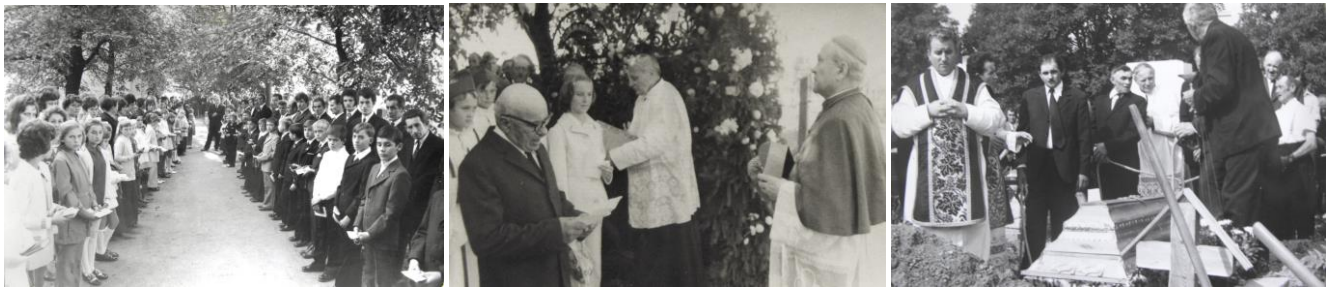
27-28. kép – Káplánként szécsenyi bérmlásokkor, a kép közepén; 29. kép – Káplánként egy szécsenyi temetésen

Érdekes, hogy a beiktatásra konkrétan nem emlékszem, csak arra, hogy 1977 őszén eljött hozzánk és örömmel mesélte, hogy új plébánia építését tervezi a szécsenyi kultúrházzal szemben, ahol a pajta állt. Gyűjtötte a támogatókat, arra emlékszem, hogy én is felajánlottam egy havi fizetésemet. Aztán a kifárasztották, állandóan belekötöttek a tervekbe, az új plébánia építését a rendszer megakadályozta. Később ez a momentum különös jelentőséggel bírt annak a gondolatnak a megszületésében, hogy 1990 után már semmi sem állhatta útját a plébániaépítésnek.