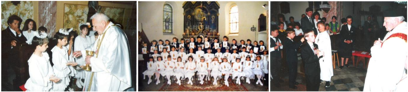
77-79. kép – Elsőáldozások a 90-es évek második feléből