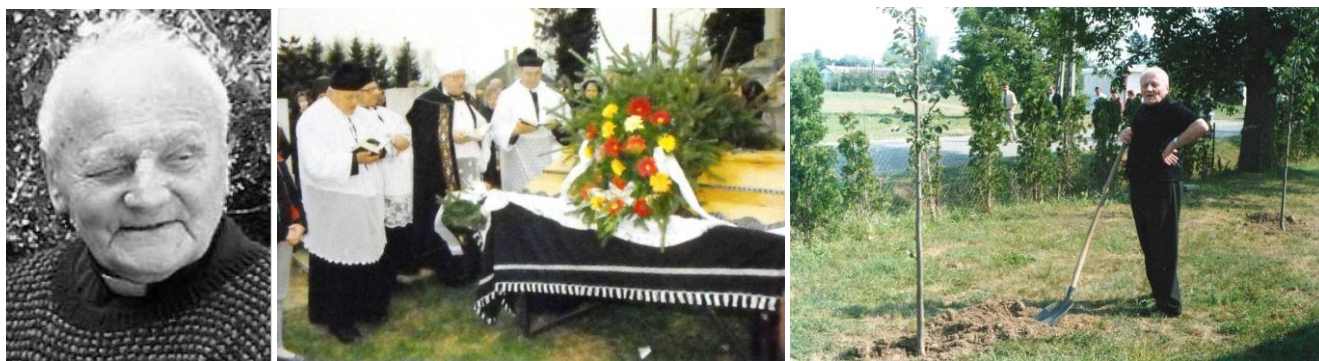
50. kép – Civilben, az elmaradhatatlan kötött pulóverében és optimizmusában; 51. kép – Temetés Szécsenyben 1987-ben 52. kép - Fákat ültet az új plébániaépület köré

1990-ben Téged választott meg a falu polgármesternek, milyen volt az együttműködés köztetek?