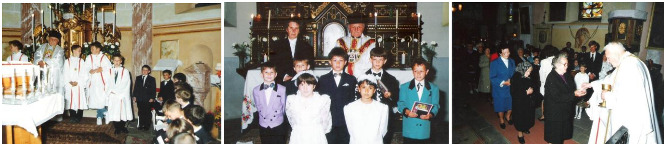
60-61. kép – Elsőáldozások Szécsényben és Tanakajdon; 62. kép – Áldoztatás a szécsényi templomban