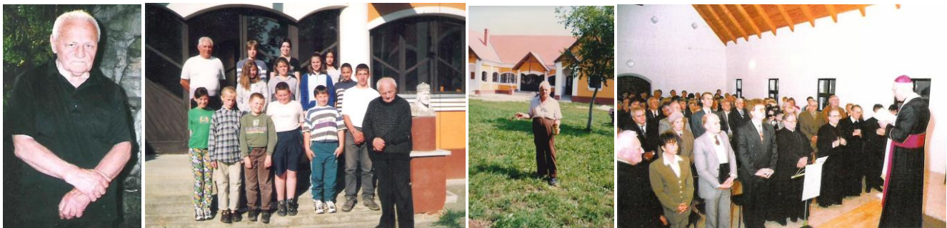
80. kép – Az udvarán lévő Lourdes-i barlang előtt; 81. kép – Hittanosokkal az elkészült közösségi ház előtt; 82. kép – Ecsettel festékekkel munka közben a közösségi ház udvarán; 83. kép – Az új közösségi ház felszentelésén 1996 decemberében