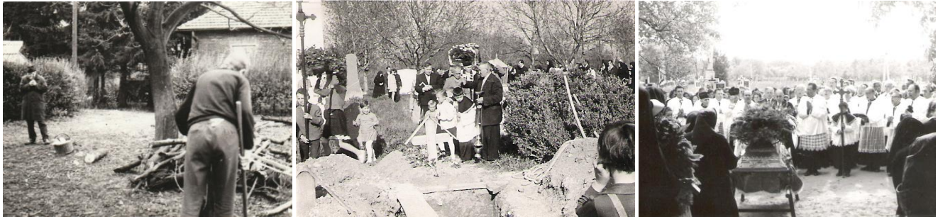
24. kép – Filmezés (filmezte, fotózta a falut) közben 1972-ben; 25-26. kép – Szécsenyi temetéseken kántorként, majd káplánként

1977-ben 60. születésnapján iktatják be plébánosnak, Te ekkor érettségiztél Pannonhalmán. Ebben az időben is szoros kapcsolat fűzött hozzá?