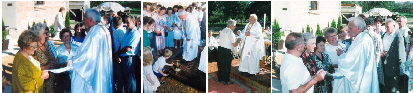
70-73. kép – Aranymiséjén hívei közt 1995. augusztus 13-án