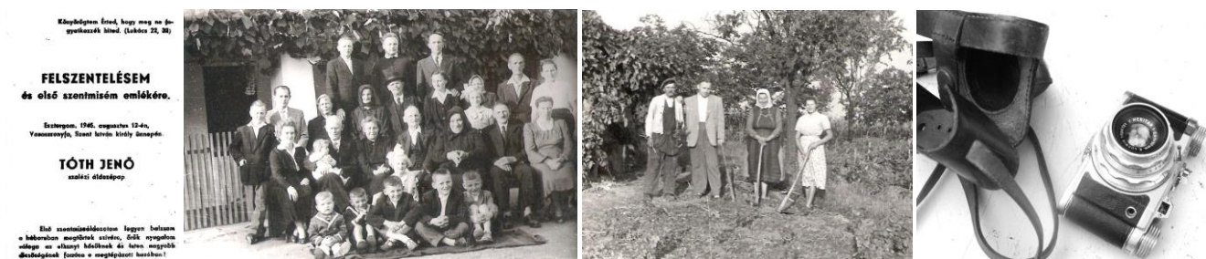
5. kép – Újmiséje 1945-ben Vasasszonyfán; 6. kép - Vasasszonyfai csoportkép a családjáról; 7. kép – Szüleivel; 8. kép – Fényképezőgépe