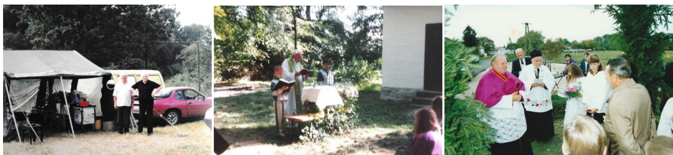
74. kép – Cserkésztáborban; 75. kép – Tábori misén; 76. kép – Érkezés a tanakajdi templomhoz

Ugyanígy kitüntetett nap volt az új plébánia felszentelése, erre hogy emlékszel?