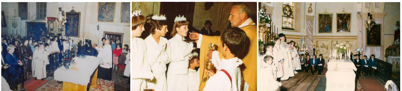
43-45. kép - Elsőáldozások a szécsényi templomban