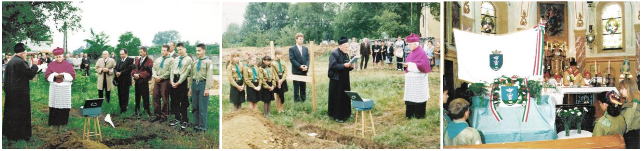
57-58. kép – Az új plébánia és közösségi ház alapkövetételén 1993-ben; 59. kép – Zászlószentelés a szécsényi templomban 1994-ben

A rendszerváltáskor megbízták a szombathelyi szalézi rendház újjászervezésével, ebbe a munkába tudtál neki segíteni valamit?