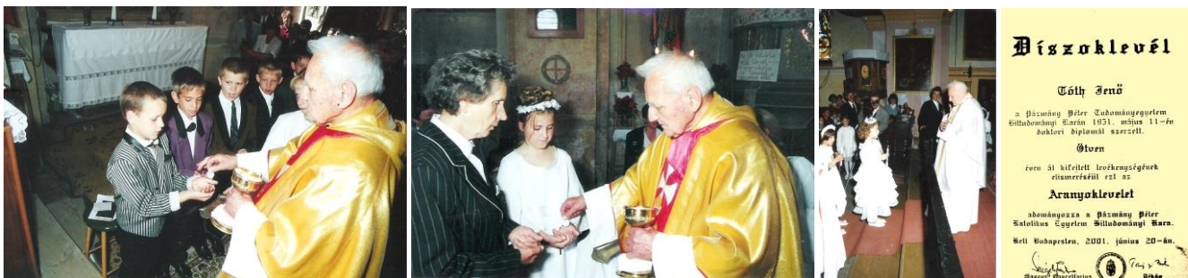
87-89. kép Elsőáldozások az ezredfordulón; 90. kép – Aranyoklevele 1991-ben

Keresztes András minden lerombolt, amit Jenő atya felépítetett, Tanár Úrral ezt már az első jelekből láttuk. Konkoly püspök úr később elismerte, hogy nagy hiba volt ez a döntés, elmondta, hogy az új plébános még a plébániát is el akarta adni. A szalézi rendházba történő