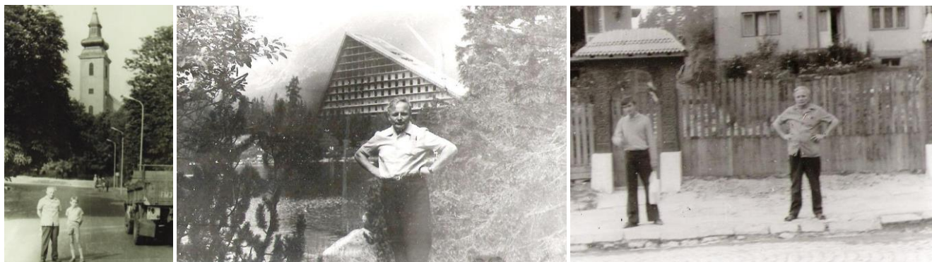
18. kép – Búcsújáró útjai egyikén; 19. kép – Zakopánében; 20. kép – Erdélyben